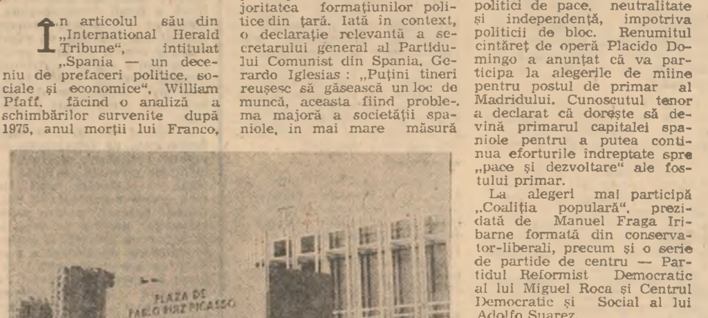
În articolul său din "International Herald Tribune", intitulat "Spania - un deceniu de prefaceri politice, sociale și economice", William Pfaff...