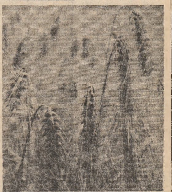
Nerădătoare să devină Pitești...