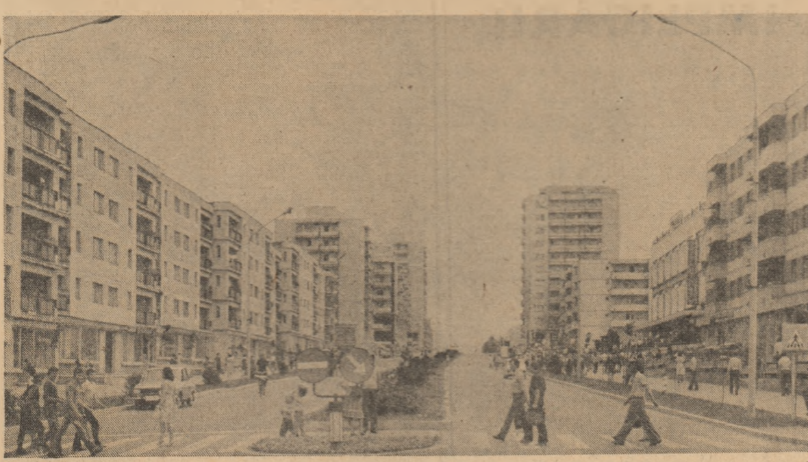
Imagine din Vaslui

● Adunarea generală — spațiu al angajării concrete: în obiectiv — pregătirea pentru o agricul- tură intensivă ● Copii frumoși și sănătoși pentru tinerețea și vigoarea patriei — Fericierea se tră- iește ● Bătălia pentru nou, bătălia pentru noi — Starea de performanță ● Film — Conștiința im- placării ● Rubrica AZI ● Sport — Cupele europene la fotbal, ediția 1986-1987; Meridian