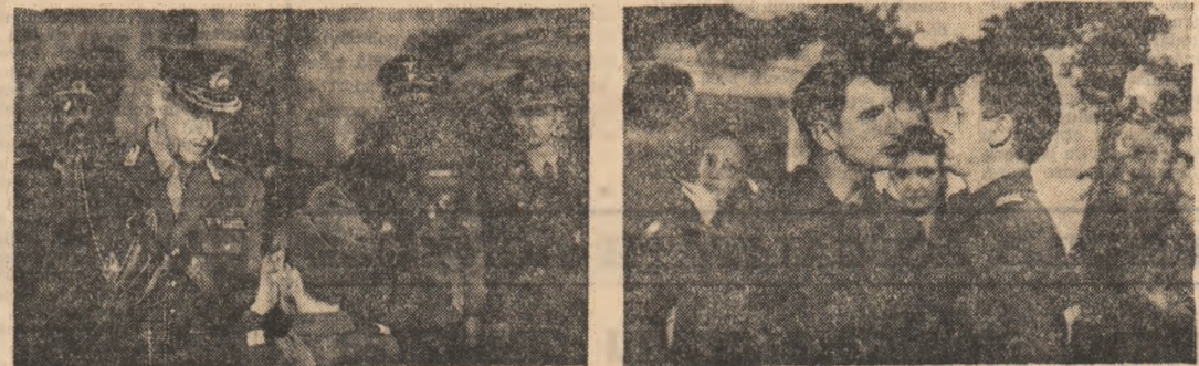
Ca întotdeauna, Sergiu Nicolaescu se află în prima linie a cinematografului nostru. Pluralul modestiei poate fi învațat și de unii creatori tineri... (Noi, cel din linia întâi; scenariu — Titus Popovici; regia — Sergiu Nicolaescu, în imagine, în rolul generalului Marinescu)