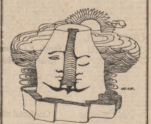
Schiță de monument la fărmla mării. Desen de MARIAN AVRAMESCU

Complexul sportiv „Tineretului” atrage în aceste frumoase zile de vacanță mii și mii de tineri, veniți din toate colțurile Bucureștilor, pentru mișcare și petrecerea plăcută, recreativă a acestor frumoase zile de vară.