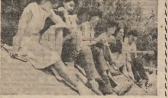
Tabără de instruire