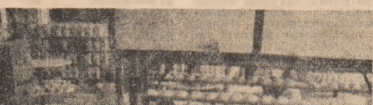
Întreprinderea de producție pentru căi ferate.