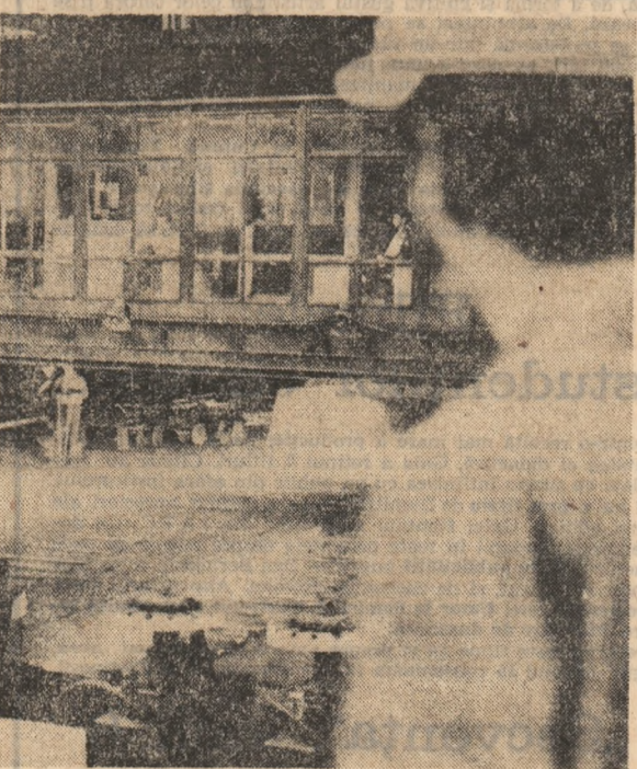
PAGINA A 2-A

Un eveniment cultural-educativ în viața tinerei generații GALA FILMULUI CU TEMATICĂ PENTRU TINERET