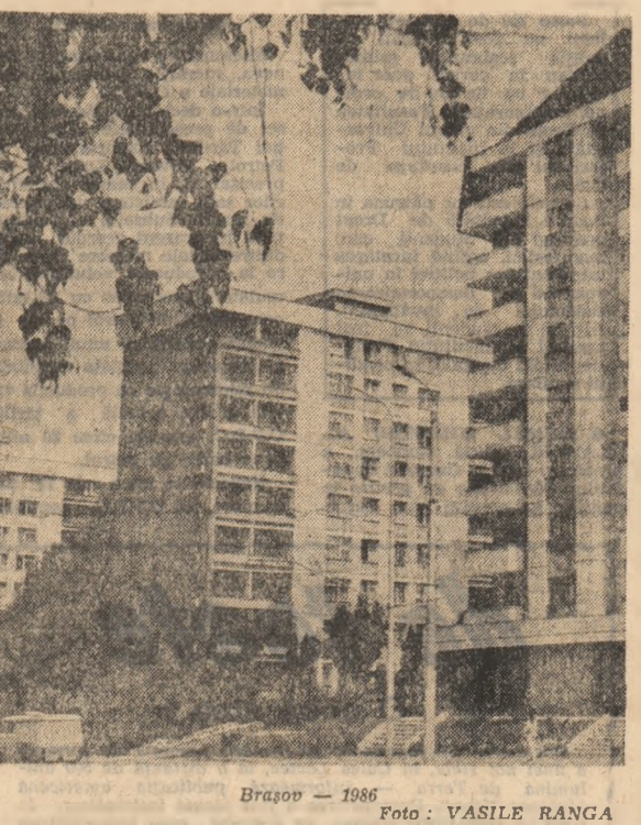
Brașov — 1986

În intervalul 21-31 august, în zonele de deal și de munte, precum și în sudul țării, vremea va fi în general instabilă, cu ploii mai ales sub formă de aversă. În celelalte regiuni va predomina o vreme în general frumoasă, cu ploii de scurtă durată. Temperaturile minime vor fi cuprinse între 8 și 18 grade, izolat mai coborîte în depresiuni, iar cele maxime între 18-28 grade, mai ridicate în zonele de cîmpie la începutul intervalului, cînd frecvent vor depăși 30 de grade.