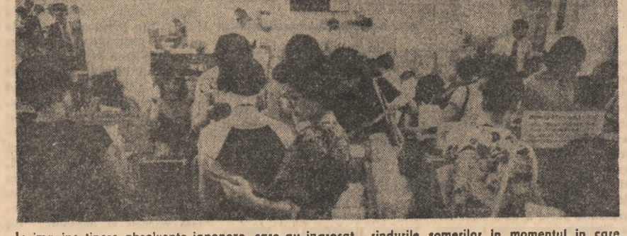
În imagine tinere absolvente japoneze, care au îngroșat rîndurile șomerilor în momentul în care au părăsit băncile școlii, în căutarea unei slujbe la unul din oficiile de plasare a forței de muncă din Tokio

tăți se dovedește inefficientă. În jumătate din școli s-a constatat necesitatea diversificării conținutului programelor școlare în ceea ce privește sistemul de învățămînt și constituirea unui motiv de îngrijorare, se specifică în raportul amintit. La scăderea moralului, alături de elevilor, cit și al profesorilor, contribuie starea în care se află imobilele școlare. Dacă nu se vor lua măsuri urgente pentru repararea acestor clădiri, se poate ajunge în situația ca ele să nu mai poată fi folosite. Unul din aspectele cele mai alarmante îl reprezintă calitatea slabă a predării. Proportia lecțiilor considerate satisfăcătoare a scăzut cu cinci la