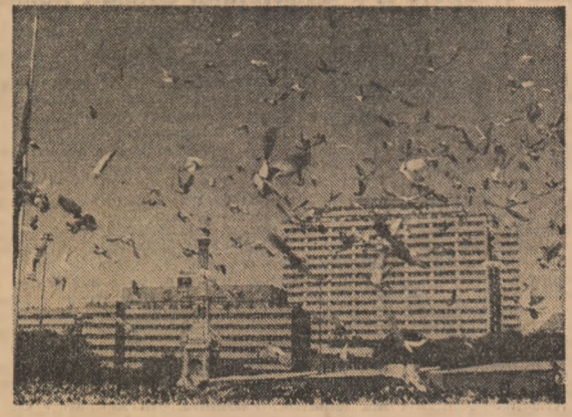
Dincolo de nuanțele opțiunilor politice ale spaniolilor, dominantă este dorința de pace, reafirmată și în cadrul unui miting desfășurat la Madrid, la care au fost lanșați 50.000 de prumbei.

Actualul cabinet se prezintă ca un bloc monolit și monocolor al socialiştilor. Portofoliile economice și finanțelor, apărării, afacerilor interne și externe se mențin, fără schimbarea titularilor învestiți la 4 iulie 1985. Agenția E.F.E. rămâne, în această ordine de idei, ca ne aflăm în fața unui „dintre cele mai stabile cabinete vest-europene”. Titularii noi au fost numiți la ministerul Industriei, sănătății, muncii și la ministerul în sarcină cu problemele raporturilor cu parlamentul, creat după ultimele alegeri. De asemenea, a fost înființat portofoliul ministerial al administrației publice, renunțându-se în schimb la cel al președinției guvernului.