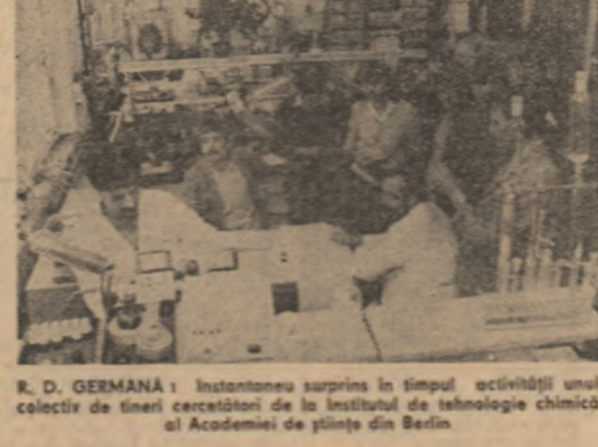
R. D. GERMANĂ — Instantaneu surprins în timpul activității unei echipe de cercetători de la Institutul de tehnologie chimică al Academiei de științe din Berlin.

TEHERAN 4 (Agerpres) — Un comunicat militar dat publicității de agenția IRNA informează că, în ultimele 24 de ore, pe frontul de sud artileria iraniană a bombardat poziții irakiene, acțiuni soldate cu uciderea a două irakieni și a peste zece militari irakieni și cu pagube materiale. Au fost auzite tirurile de artilerie pozițiilor militare irakiene de pe frontul de nord-est. Incidentul a fost înregistrat în tehnică militară și forță de luptă.