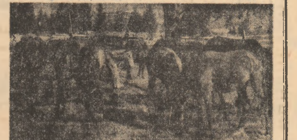
În potenile Lucinei, județul Suceava.