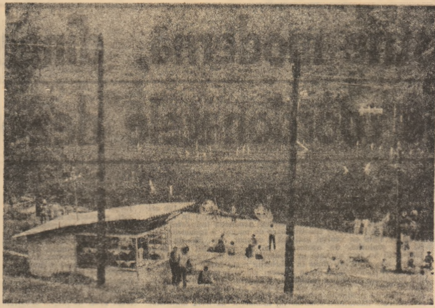
Lacul Roșu

Anchetă realizată de MARINA ALMĂȘAN-UNGUREANU