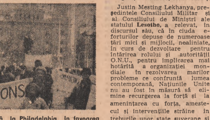
S.U.A. — Demonstrație desfășurată la Philadelphia în favoarea dezarmării nucleare

Agencia A.P. reamintește că, în conformitate cu hotărârile N.A.T.O., în R.F.G. au fost amplasate 108 rachete Pershing II la bazele de la Mutlangen, Neu Ulm și Heilbronn.