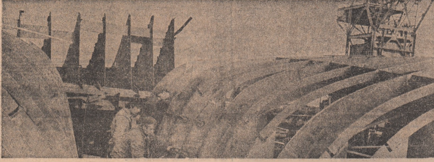
Șantierul naval Oltenița