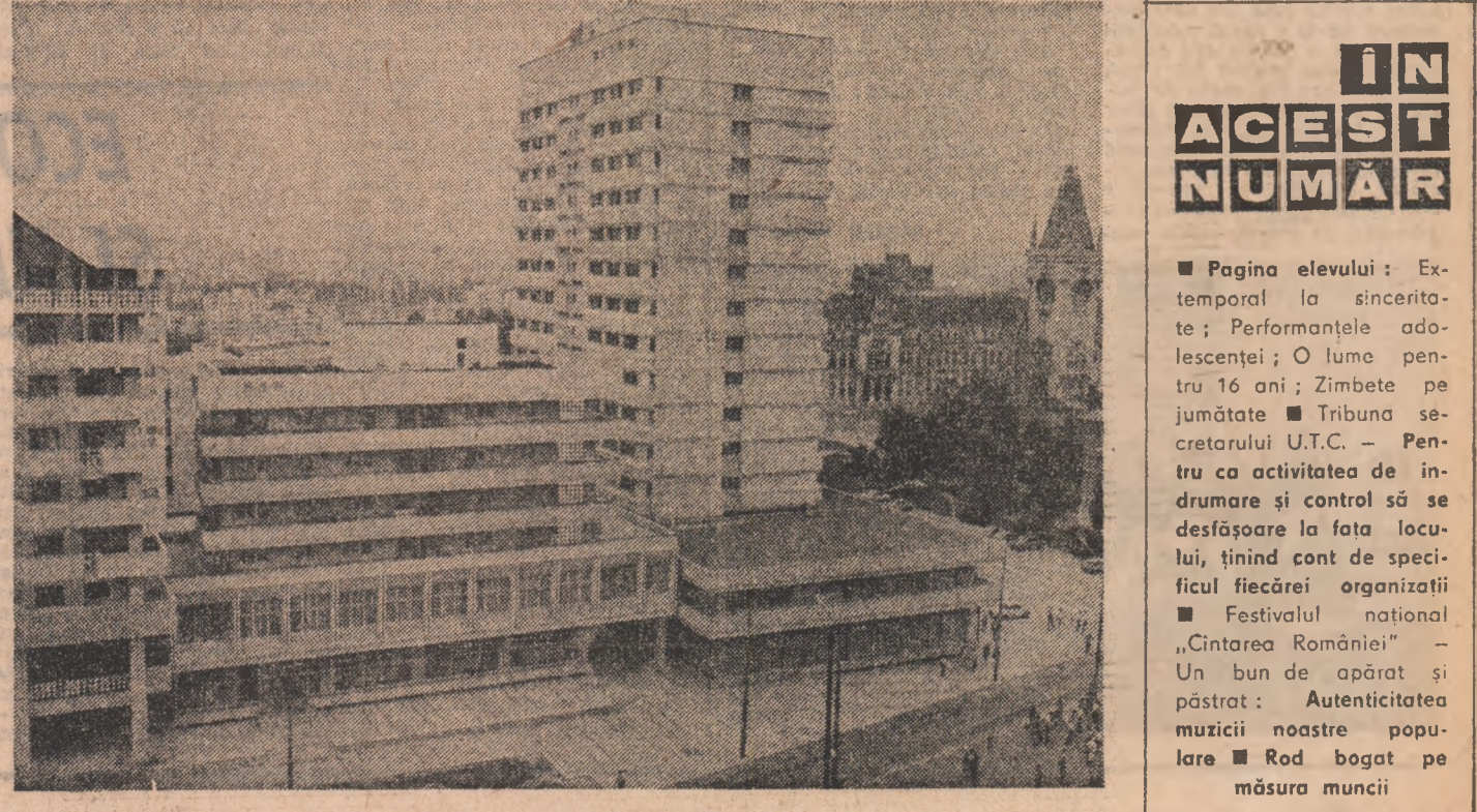
Imagine din municipiul Iași

CĂTALIN BORDEIANU (Continuare în pag. a IV-a)