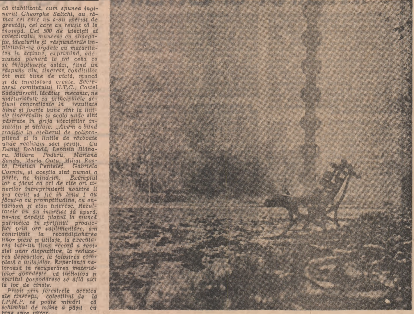
Toamnă în țară

În altă ordine de idei, s-a reținut în ultima vreme, cu foarte mare ușurință la țările noastre, în interpretările actuale a folclorului nostru rezidă în moduli cum sint organizate spec-