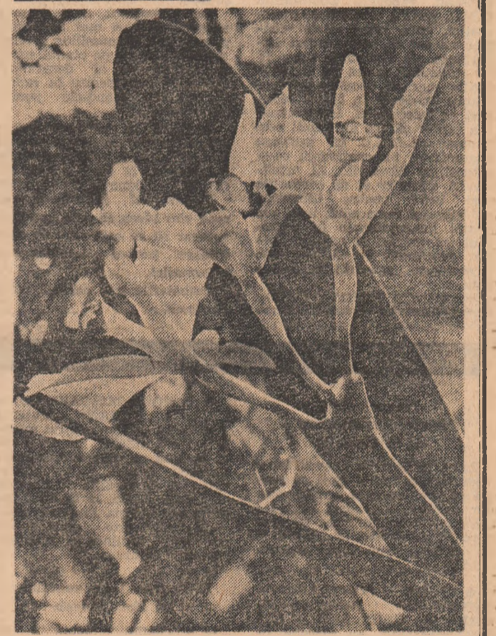
Florile din fereastră