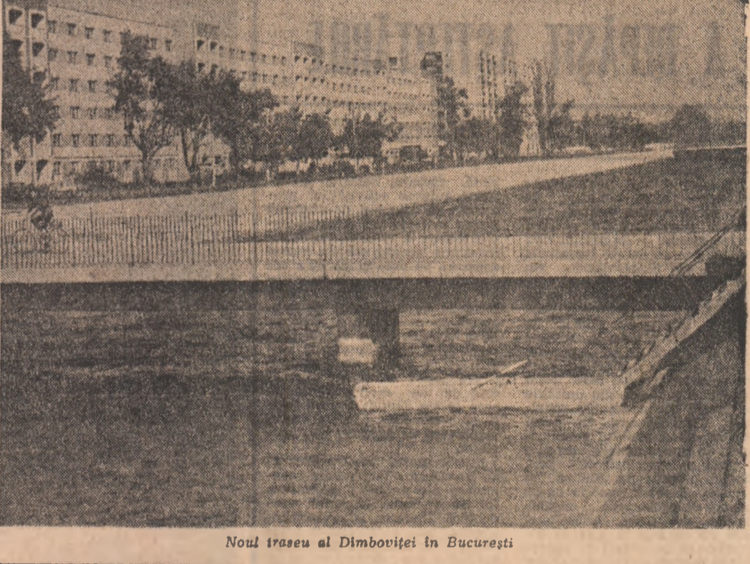
Noul traseu al Dimboviței în București