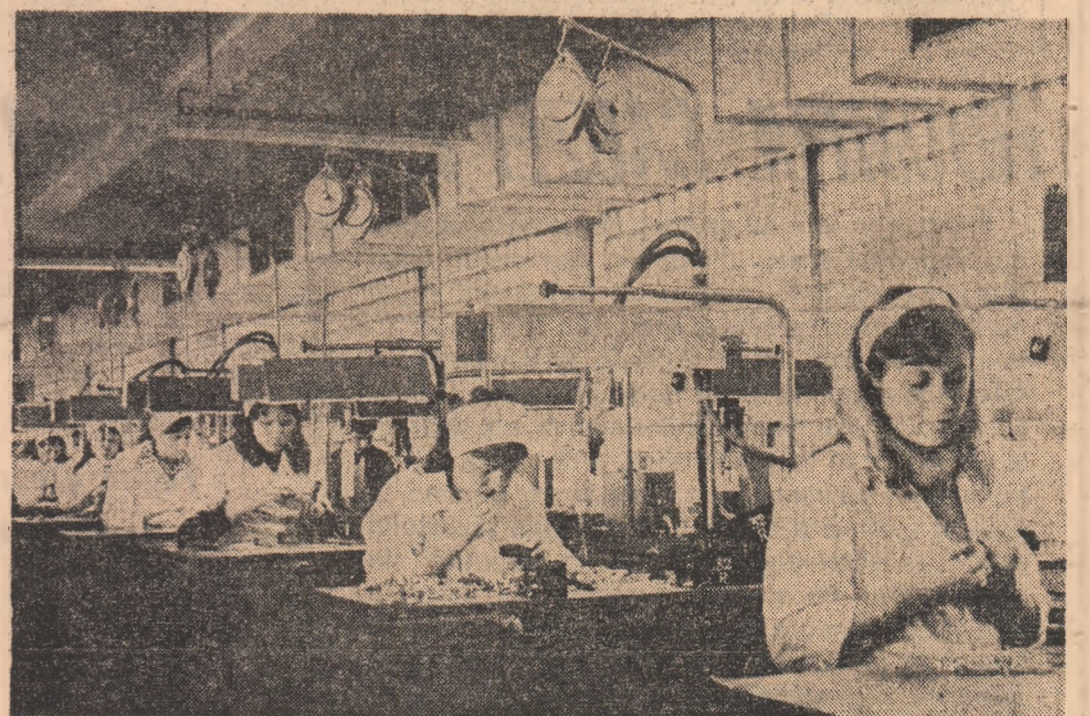
Întreprinderea de Contactoare din Buzău