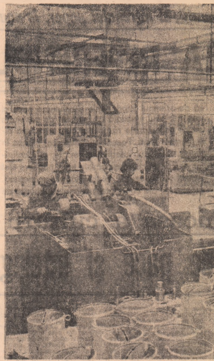
Întreprinderea de Utilaj Miner Petroșani

Locul III: Inspectoratul silvic județean Bacău, cu 575,3 puncte.