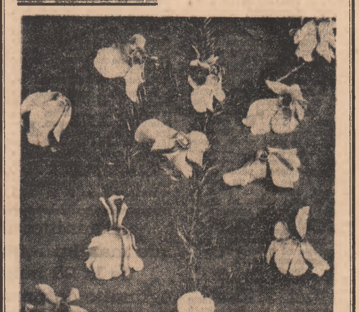
Flori de iarnă