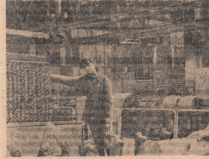
I.R.E.M.O.A.S. — București

Duminică, 23 noiembrie, s-au deschis la Budapesta, lucrările celui de-a XII-a adunări a organizațiilor membre ale Federației Mondiale a Tineretului Democrat (F.M.T.D.).