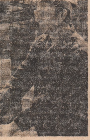
I.R.E.M.O.A.S. — București