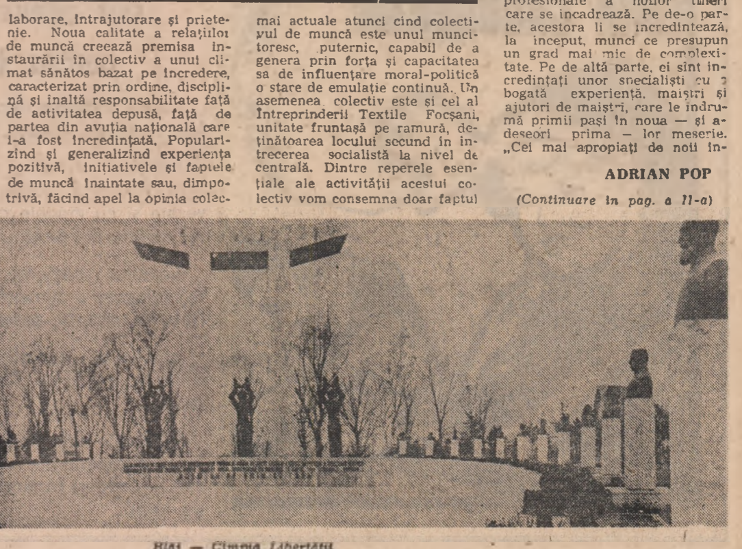
Blaj — Cimpia Libertății