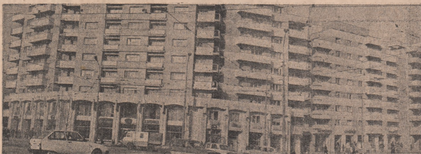
Calea 13 Septembrie din Capitală

care sintetizează cele mai largi posibilități de afirmare a spiritului ăin, creator. Într-adevăr, la acest capitol, rezultatele concrete obținute sint cele mai semnificative ca valoare științifică și economică. Avem exemple numeroase în această direcție. Iată, bunaora, la recenta CONFERINȚA NAȚIONALĂ A CERCURILOR ȘTIINȚIFICE STUDENȚEȘTI, profilul tehnic electronic, desfășurat la Institutul Politehnic Cluj-Napoca a fost evidentă preocuparea pentru lărgirea și diversificarea continuă a problematicei științifice abordate, orientarea decisivă a acestora spre resorturile fundamentale ale producției. În momentul de față cercetarea științifică studențească se dovedește a fi o acțiune sistematică, de amploare, cu valențe formative incontestabile. Se remarcă, înainte de toate, abordarea problemelor de vîrf ale tehnicii — calculatoare, electronică, cibernetică, robotică. Unul din suportii prin-