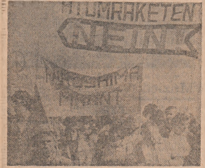
Demonstrație pentru pace și dezarmare, desfășurată în localitatea vest-germană Fulda, în apropierea căreia se află una din bazele militare americane staționate pe teritoriul R.F.G.