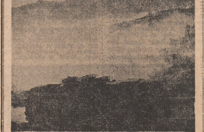
Dimineața devreme, alergînd spre o mirifică întîlnire.