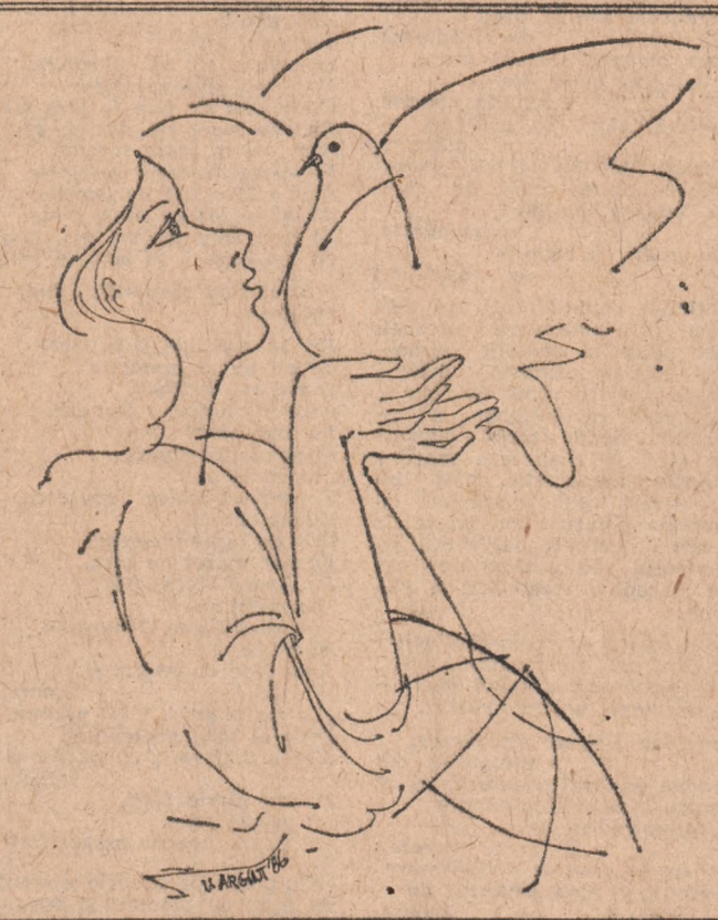
Desene de VICTORIA ARGINT