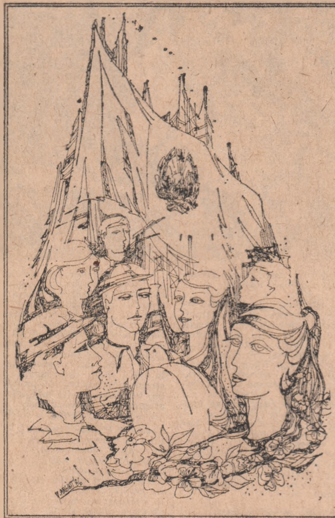
Desene de VICTORIA ARGINT