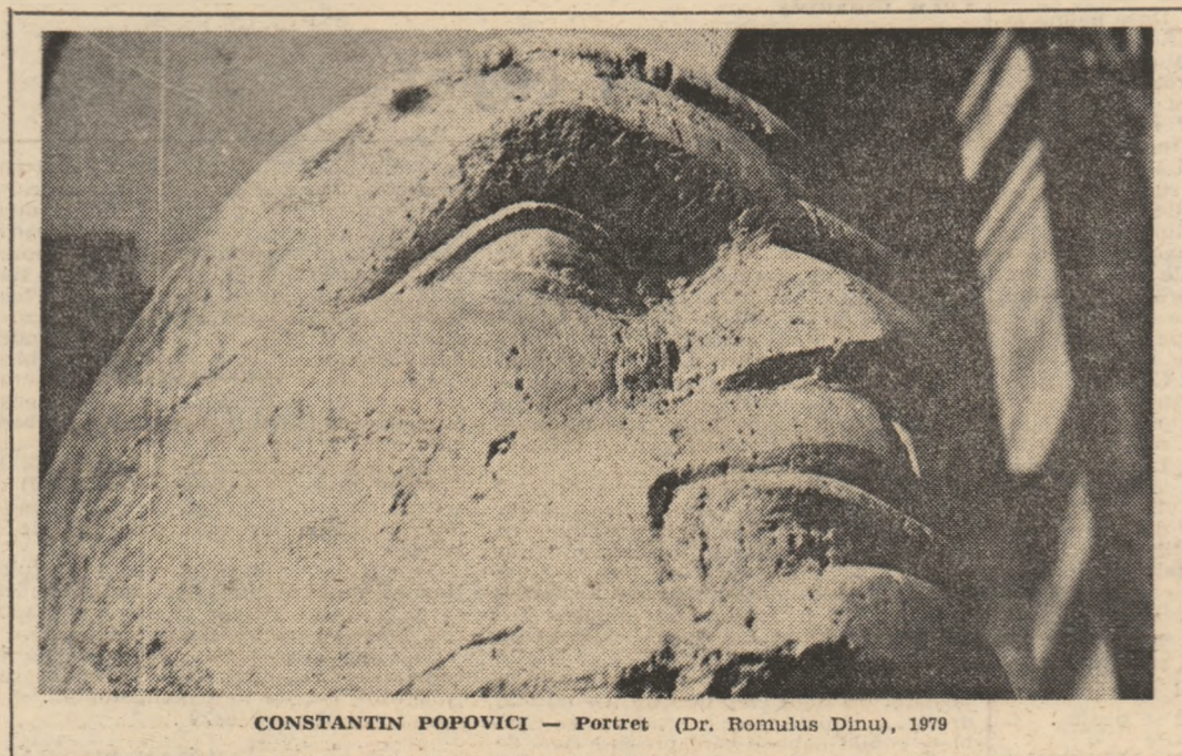
CONSTANTIN POPOVICI — Portret (Dr. Romulus Dinu), 1979