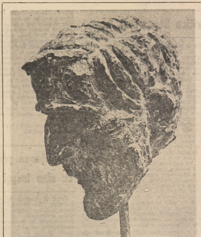
CONSTANTIN POPOVICI — George Bacovia, 1963