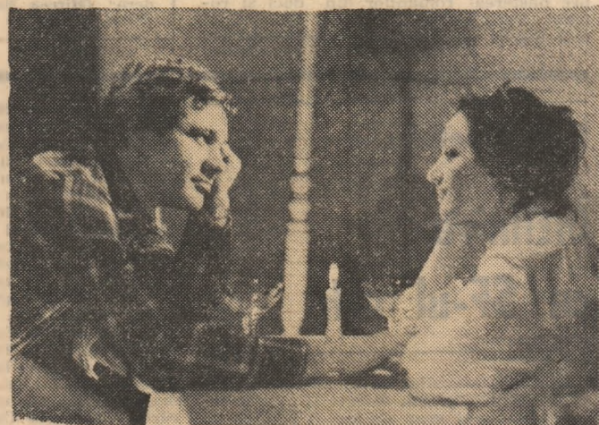
Scenă din spectacolul cu plesa „Concurs de împrejurări“, de Adrian Dohotaru, la Teatrul C. I. Nottara din București. În pagina a opta, opiniile critice și comentariile pe marginea spectacolului la rubrica „Cronica teatrală“