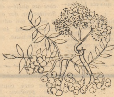
Desen de MIHAELA NACU

Fluture rupt din visul nopții noaptea ce nu a început încă peșteră pe inima ce nu a bătut încă