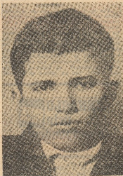
Tinărul revoluționar Nicolae Ceaușescu în anul 1933

În aceste zile de sfârșit de mai și început de iunie 1986 se împlinesc 50 de ani de la procesul de la Brașov, intentat unui grup de tineri comuniști și militanți antifasciști ce-l aveau în frunte pe neînfricatul revoluționar Nicolae Ceaușescu.