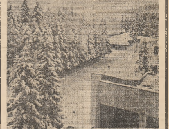
Feerie montană