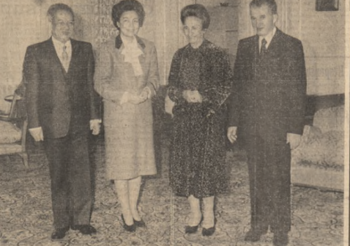
Tovarășii Nicolae Ceaușescu și tovarășa Elena Ceaușescu au avut o discuție deosebit de interesantă și de fructuoasă pe lângă prezentarea și înțelegerea tradițiilor culturale. Președintele și soția sa au prezentat și au discutat despre situația actuală a țării noastre, problemele economice și culturale, precum și despre activitatea desfășurată în domeniul științific și tehnologic.

Tovarășii Nicolae Ceaușescu, președintele Republicii Socialiste România, și tovarășa Elena Ceaușescu s-au întâlnit, luni, cu președintele Republicii Democratice Norododome Sianuk, cu soția sa, prințesa Monique Sianuk, într-o vizită de prietenie în țara noastră.