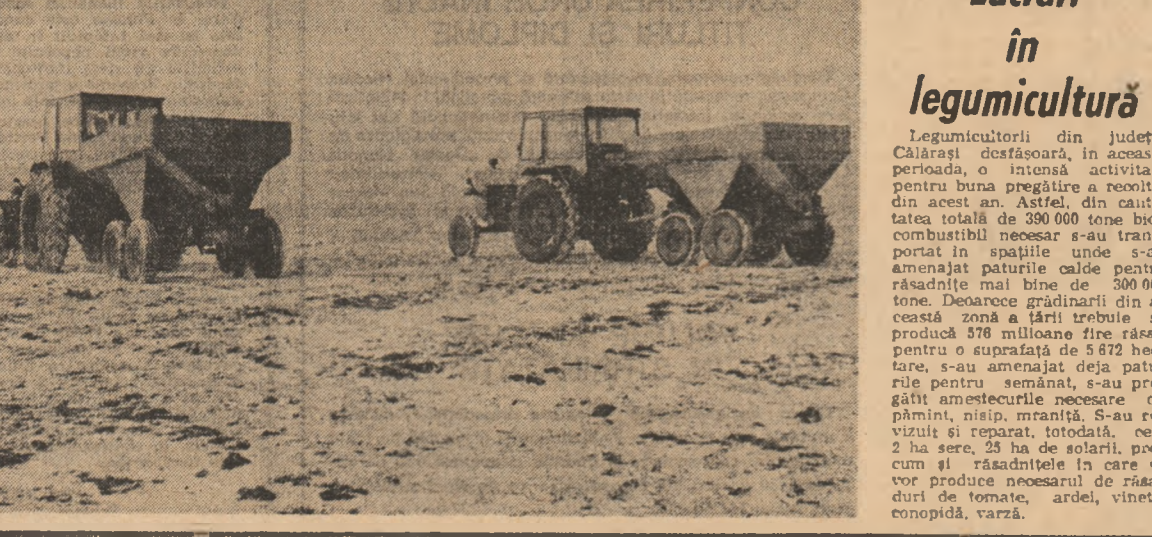
Lucrări în legumicultură