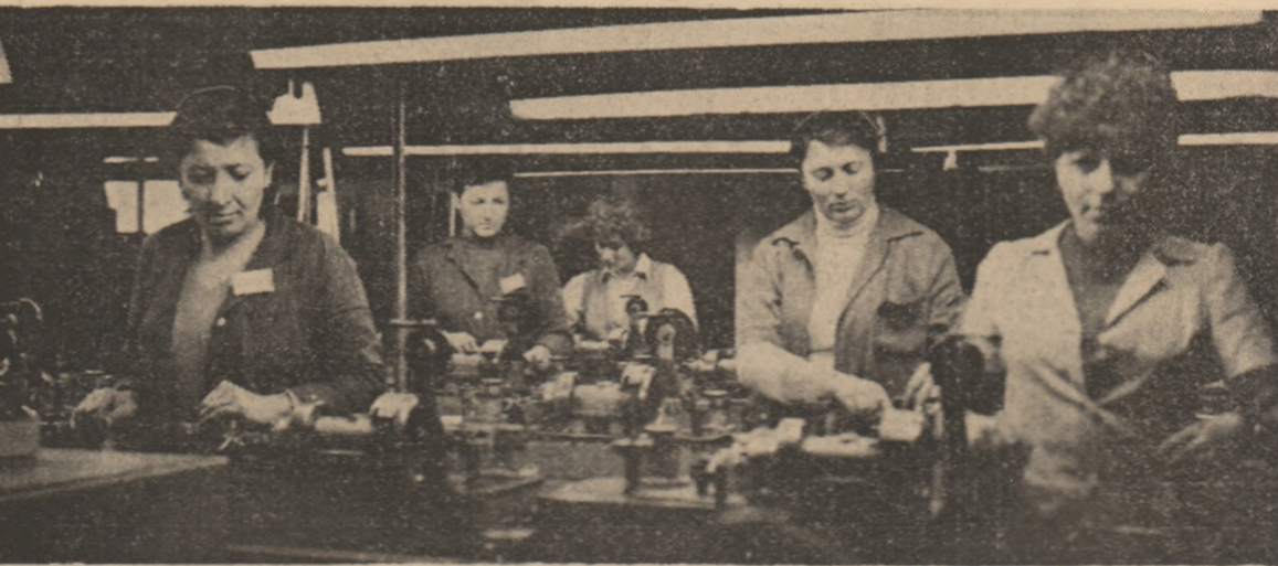
La Întreprinderea „Steaua Electrică“ Fieni — județul Dimbovitza