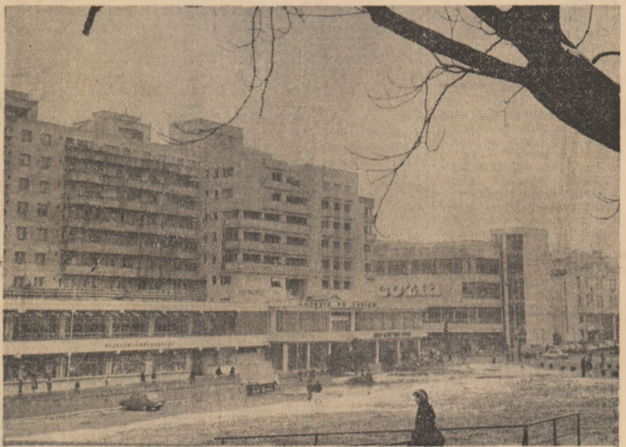
Imagine din municipiul Rm. Vilcea