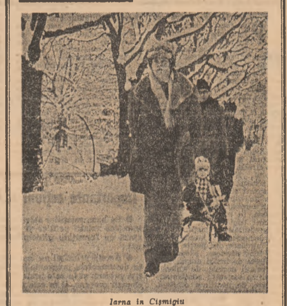
Înarma în Cismigiu