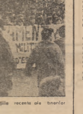
Aspect de la una dintre demonstrațiile recente ale tinerilor spanioli.

Zilele trecute, în grupul de lucru pentru problemele umanitare al reuniunii general-