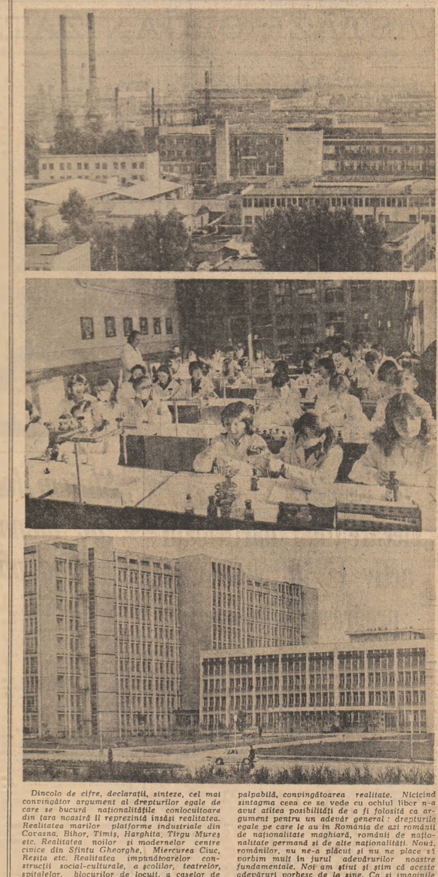
Dincolo de cifre, declarații, sinteze, cel mai convingător argument al drepturilor egale de dezvoltare este realitatea. Realitatea din țara noastră îl reprezintă însăși realitatea. Realitatea marilor platforme industriale din Covasna, Bihor, Timiș, Harghita, Tirgu Mureș etc. Realitatea noilor și modernelor centre culturale din Sântu Gheorghe, Miercurea Ciuc, Recl etc. Realitatea impulsionării construcțiilor social-culturale, a școlilor, teatrelor, spitalelor, blocurilor de locuit, a casilor de cultură și a cîmînului cultural. Realitatea, palpabilă, convingătoare realitate. Niciind sîntagma ceea ce se vede cu ochiul liber n-a avut atîtea posibilități de a fi folosită ca argument pentru un adevăr general și drepturi egale pe care le au în România de azi românii de naționalitate maghiară, români de naționalitate germană și de alte naționalități. Nouă, românii, nu ne-a plăcut și nu ne place să vorbim mult în jurul adevărilor noastre fundamentale. Noi am avut și simțim că aceste adevăruri vorbesc de la sine. Ca și imaginile de mai sus.