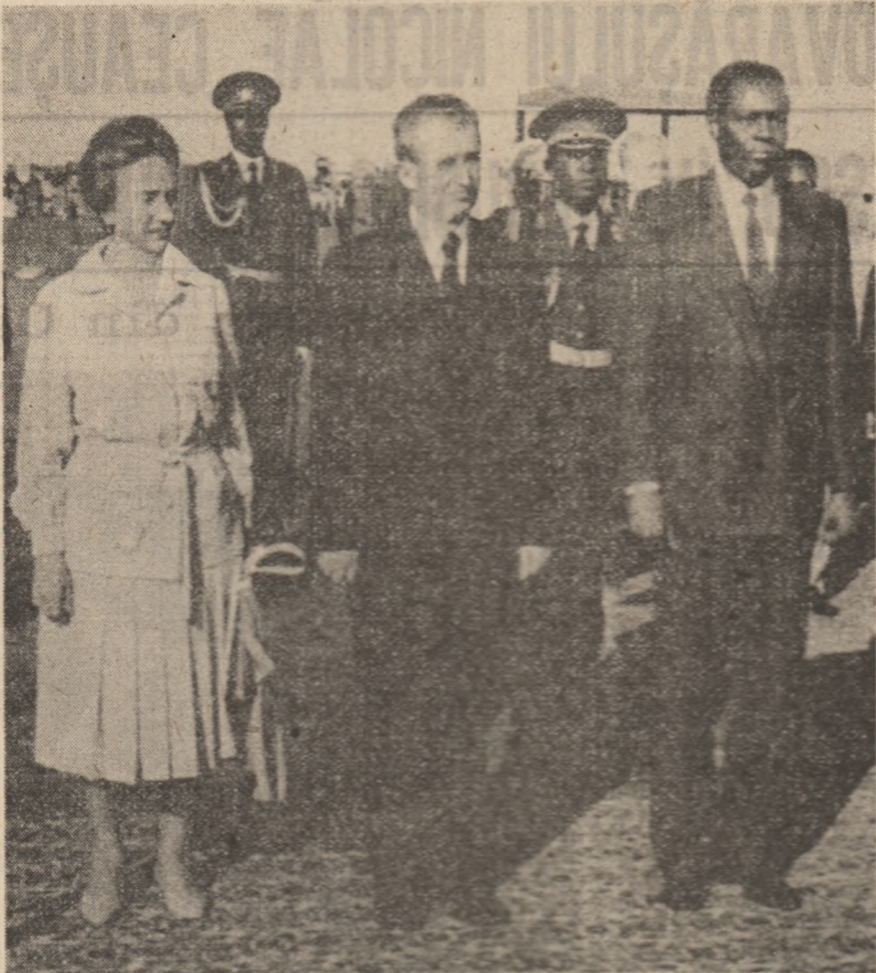
Tovarășul Nicolae Ceaușescu și tovarășa Elena Ceaușescu au fost salutați cu deosebită stăruință de șefii misiunilor diplomatice acreditate la Luanda.

Cei doi președinți se înfruntă spre podiumul special amenajat unde primesc defilarea gărzii de onoare.