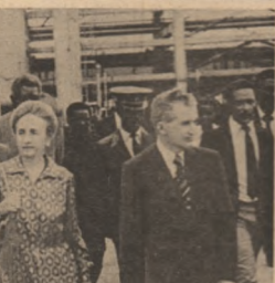
Tovarășii Nicolae Ceaușescu și Elena Ceaușescu au avut o discuție amănunțită cu rectorul Universității Angolei, privind colaborarea științifică și culturală între România și Angola.