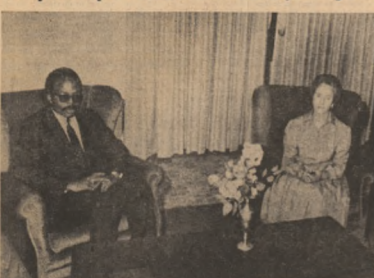
Tovarășii Nicolae Ceaușescu, secretar general al Partidului Comunist Român, rectorul Universității Angolei, și soția sa, doamna Elena Ceaușescu, împreună cu soțul ei, rectorul Universității Angolei, în timpul vizitei oficiale de prietenie în Angola.

La primit pe rectorul Universității Angolei