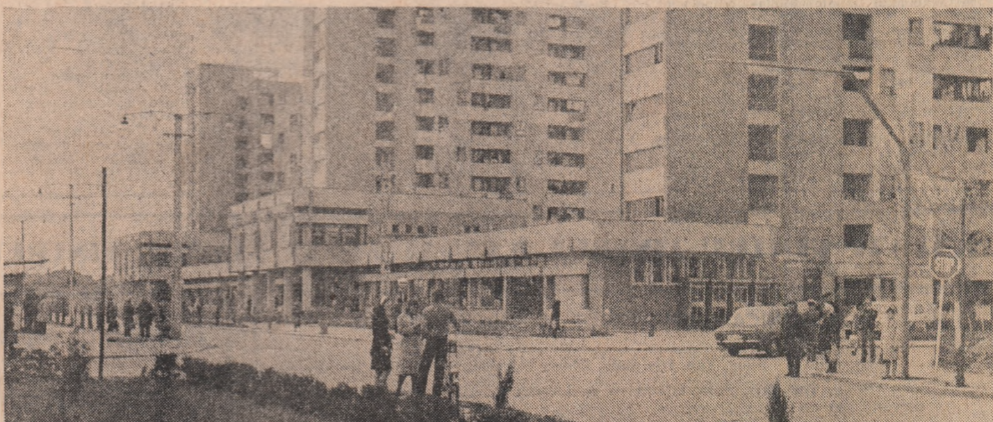
Construcții moderne în Drobeta-Turnu Severin