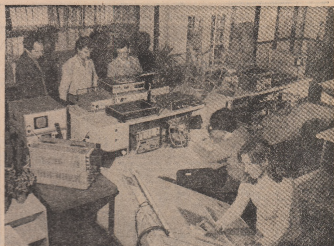
Într-unul din laboratoarele Institutului Politehnic din Cluj-Napoca

NICOLAE MILITARU (Continuare în pag. a III-a)