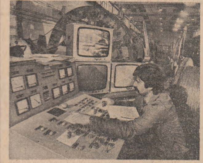
R.D. GERMANĂ — Instalații moderne de dirijare a producției la Întreprinderea de cabluri de oțel din Zwickau