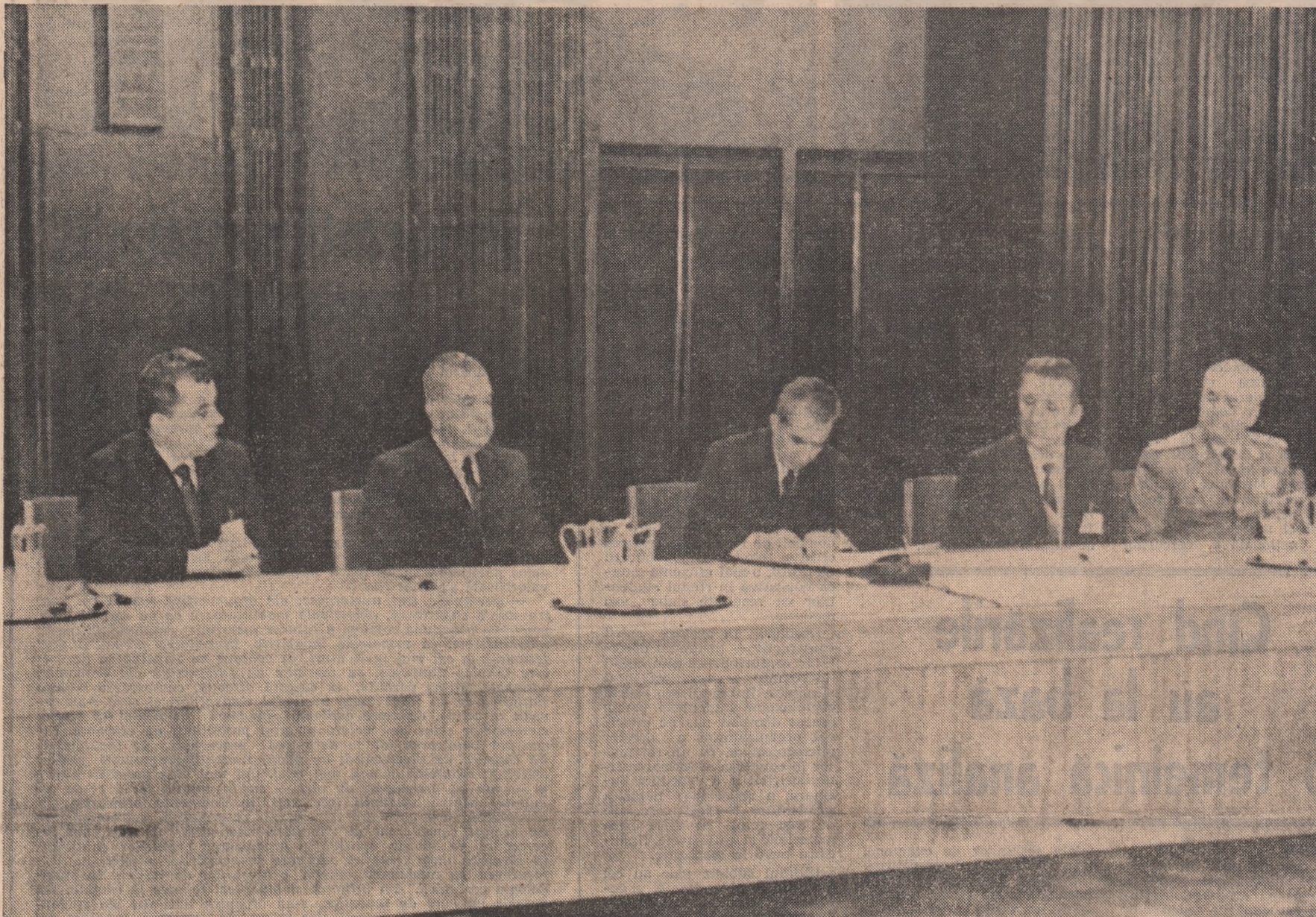
BERLIN 29 (Agerpres). — Vineri, 29 mai, la Berlin s-a încheiat Consfătuirea Comitetului Politic Consultativ al statelor participante la Tratatul de la Varșovia. În sedința de închidere a fost adoptat Comunicatul Consfătuirii Comitetului Politic Consultativ al statelor participante la Tratatul de la Varșovia. Consfătuirea s-a desfășurat într-o atmosferă de prietenie și colaborare tovarășească.