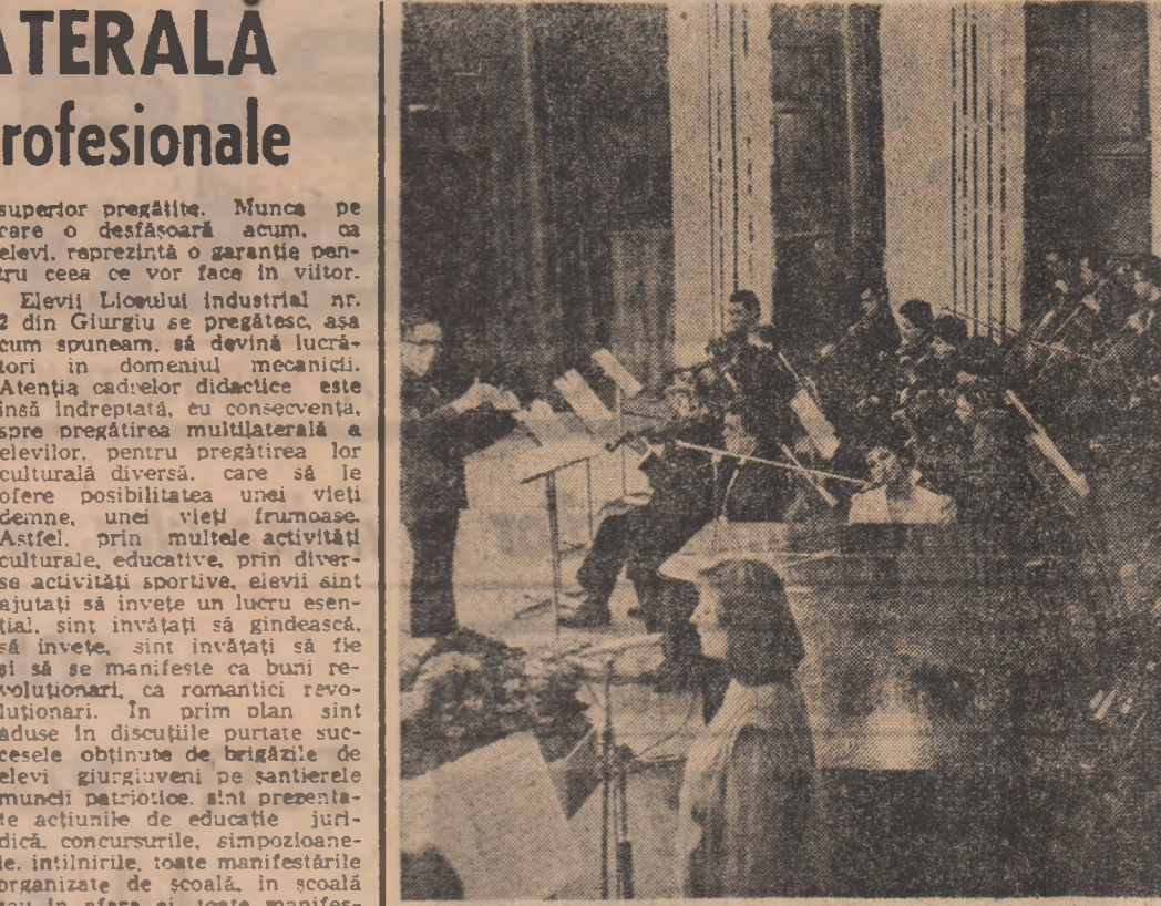
Concert la Ateneu

(Urmare din pag. 1) cunoașterii, atunci este la fel de adevărat că nu putem conștientiza cunoașterea fără discernămint critic, fără evaluare realistă și argumentată a datelor acestui demers. O butadă spune, la un moment dat, că numim cultură ceea ce rămîne după ce am uitat tot. Paradoxul este numai aparent. Poți avea o memorie foarte bună, dar să nu crezi nimic, sau cum ambția de a fi creator poate fi deservită de diletanțism, sau incompetență. Prin ele însele, tipul omului zilelor noastre, mai ales profilul intelectual al unui tînar, presupun o competență în actu, o vocație creatoare, nevoia unei sinteze reprezentative. Ar fi o iluzie păgubitoare să consideri că poți construi fără a cunoaște valorile fundamentale, reprezentative ale genului uman. Dar, este la fel de greșit să crezi că ai o bibliotecă, o automat succesul proiectului constructiv, original. Setea de cunoaștere este, prin urmare, un dat al spiritului tînar, înțeles nu doar în ordine strict biologică, ci în ordinea morală superioară a celui care „gîndește singur” și acționează, împreună cu semenii săi, pentru mai bine ale cetății, pentru progresul și prosperitatea patriei. E de prisos a mai adăuga că auto-perfecționarea în acest sens nobil nu reprezintă doar un desiderat subiectiv, ci este o necesitate logică, obiectivă a devenirii noastre revoluționare, a tineretului nostru înseși.