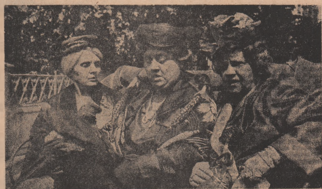
O comedie de succes, într-o versiune cinematografică originală, plină de vervă și culoare.