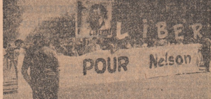
Recent pe străzile Parisului mii de tineri francezi au demonstrat, condamnd politică rasistă a regimului minoritar sud-african și cerind eliberarea imediată din închisoare a liderului populației de culoare, Nelson Mandela