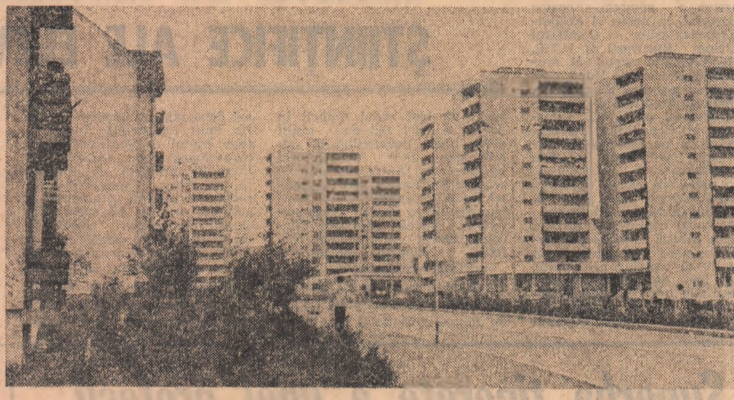
Miercurea Ciuc