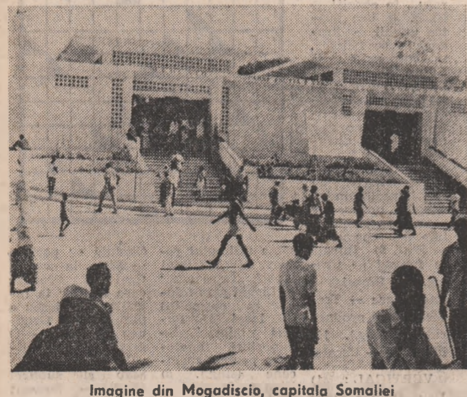
Imagine din Mogadiscio, capitala Somaliei