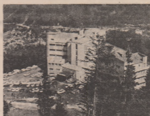
Sugestia pentru un agrement sîmbătină: hotelul Alpina din Sinaia