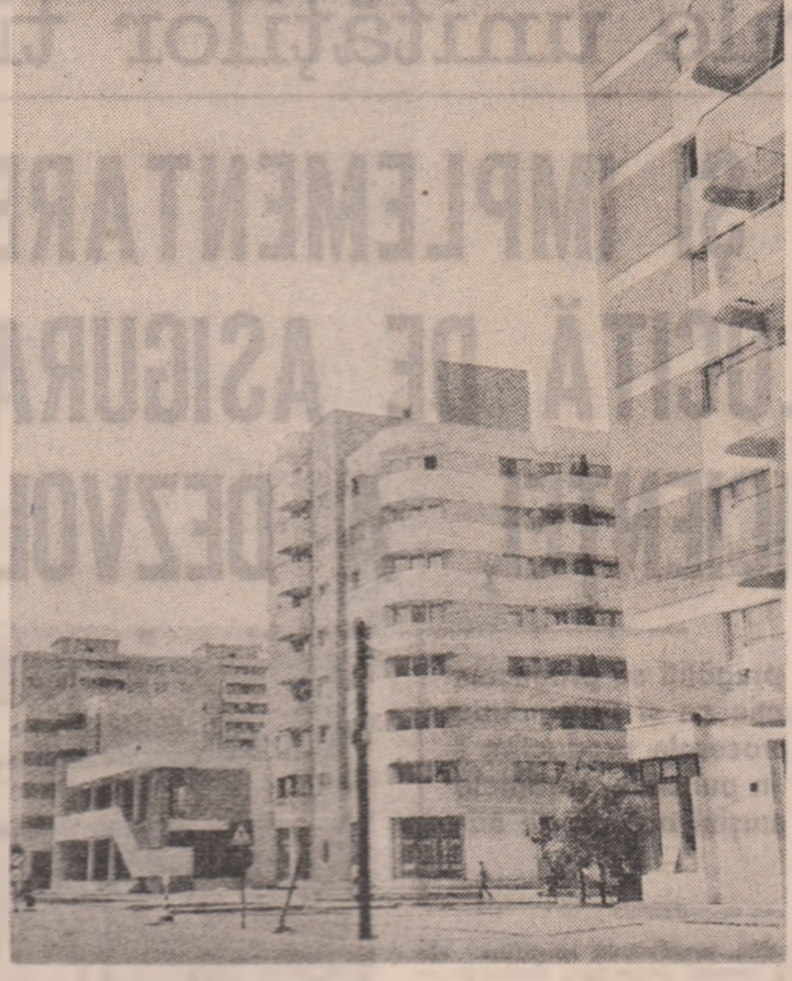
Imagine din Alexandria