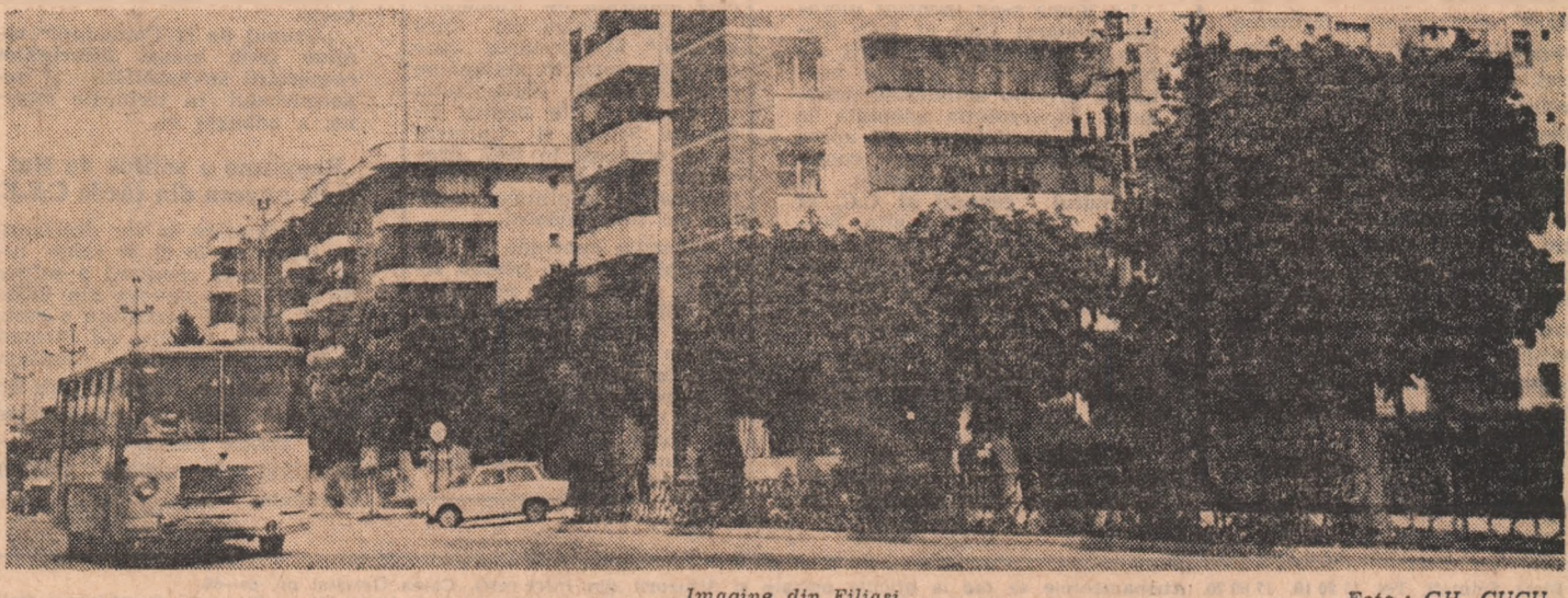
Imagine din Filiași

Toate succesele dobîndite de constructorii de instrumente muzicale de la Reghin, bunul renume cîștigat în țară și peste hotare ne fac nu numai să sperăm, dar să fim convinși că Reghinul trebuie și va rămîne fărî îndoieli în continuare una din marile școli de lutieri din Europa și din lume.