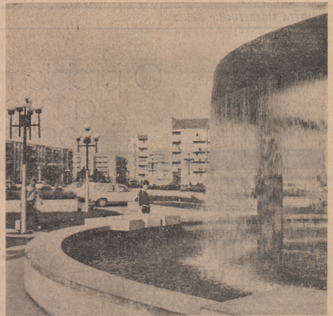
Imagine din Bistrița