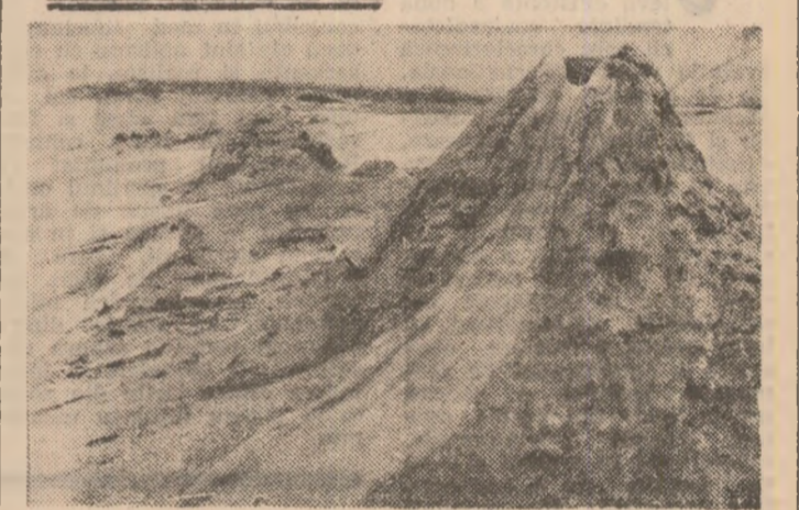
Un fenomen al naturii - vulcanii noroșii de la Pielele (Județul Buzău) surprinși pe holul de corespondența noastră...