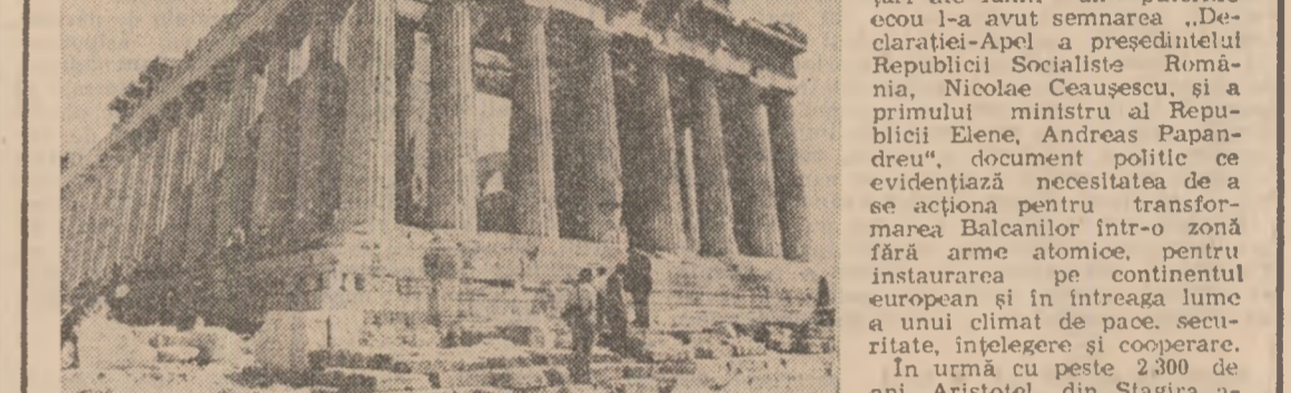
La 5 km de mare și la o înălțime de 156 m, pe Acropola ateneană, domină Partenonul. Dacă secole de-a rîndul vechii greci urcau pînă aici în momentele de sărbătoare, astăzi cetățenii Atenei și din alte regiuni ale țării au alcătuit, ținîndu-se de mîna, un lanț viu în jurul colinei. Un gest care, în registrul simbolic, păzește centrul metropolei spirituale a Greciei de amenințarea pericolului de război

oameni, de la politicieni, personalități din lumea artelor, științei și sportului, pînă la tînărul care vindea bilete la intrarea în Muzeul din Olympia. Dincolo de cronica politică, toți erau unanimi în a sublinia necesitatea realizării unei păci trinitice, imperativul înlăturării instalațiilor militare străine. Pornind de la considerentul că prezenta buzoare „constituie o sîrbire a independenței și suveranității naționale”, prin intermediul unui acord încheiat cu S.U.A. guvernul