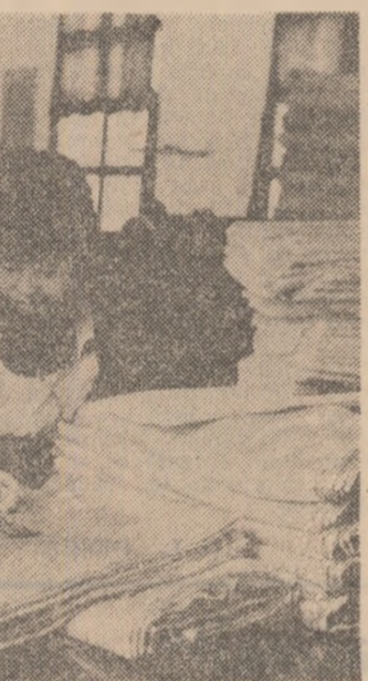
R. P. CHINEZA — Imagine din secția de control a produselor fabricii de mătase din orașul Zunyi.

În așezările din teritoriile arabe ocupate continuă să se mențină o situație încoadată, ca urmare a intensificării valului de represiuni israeliene împotriva populației locale. În numeroase cartiere ale orașului Gaza, centrul administrativ al teritoriului cu același nume, au fost instituite restricții de circulație, trupe ale poliției și armatei patrulând pe străzi. Și în localitățile de pe malul vestic al Iordaniei au fost trimise noi contingente de soldați și trupe de securitate israeliene. Astfel, în orașul Nablus — unde au fost instituite, de asemenea, restricții de circulație — trupele de ocupație procedeau la percheziții și interogatorii. (Agerpres)