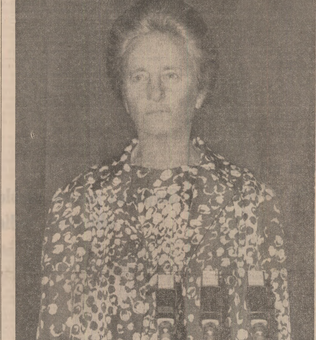
(Continuare în pag. a III-a)