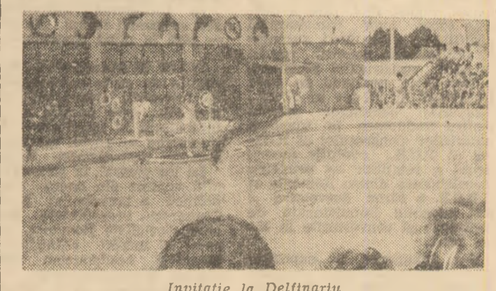
Invitație la Delfinariu