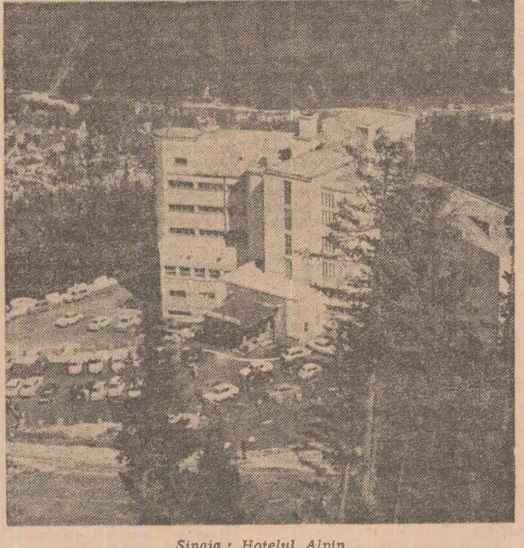
Sinaia: Hotelul Alpin

Cu prilejul zilei Namibiei, miercuri după-amiază, a avut loc în Capitală o manifestare culturală organizată de Liga română de prietenie cu popoarele din Asia și Africa și al I.R.R.C.S., reprezentanți al Ministerului Afacerilor Externe, studenții namibieni care se pregătesc în instituții de învățămînt superior din țara noastră, un numeros public. A fost prezent Bernard Kamwi, reprezentant permanent al S.W.A.P.O. la Namibia, la București.