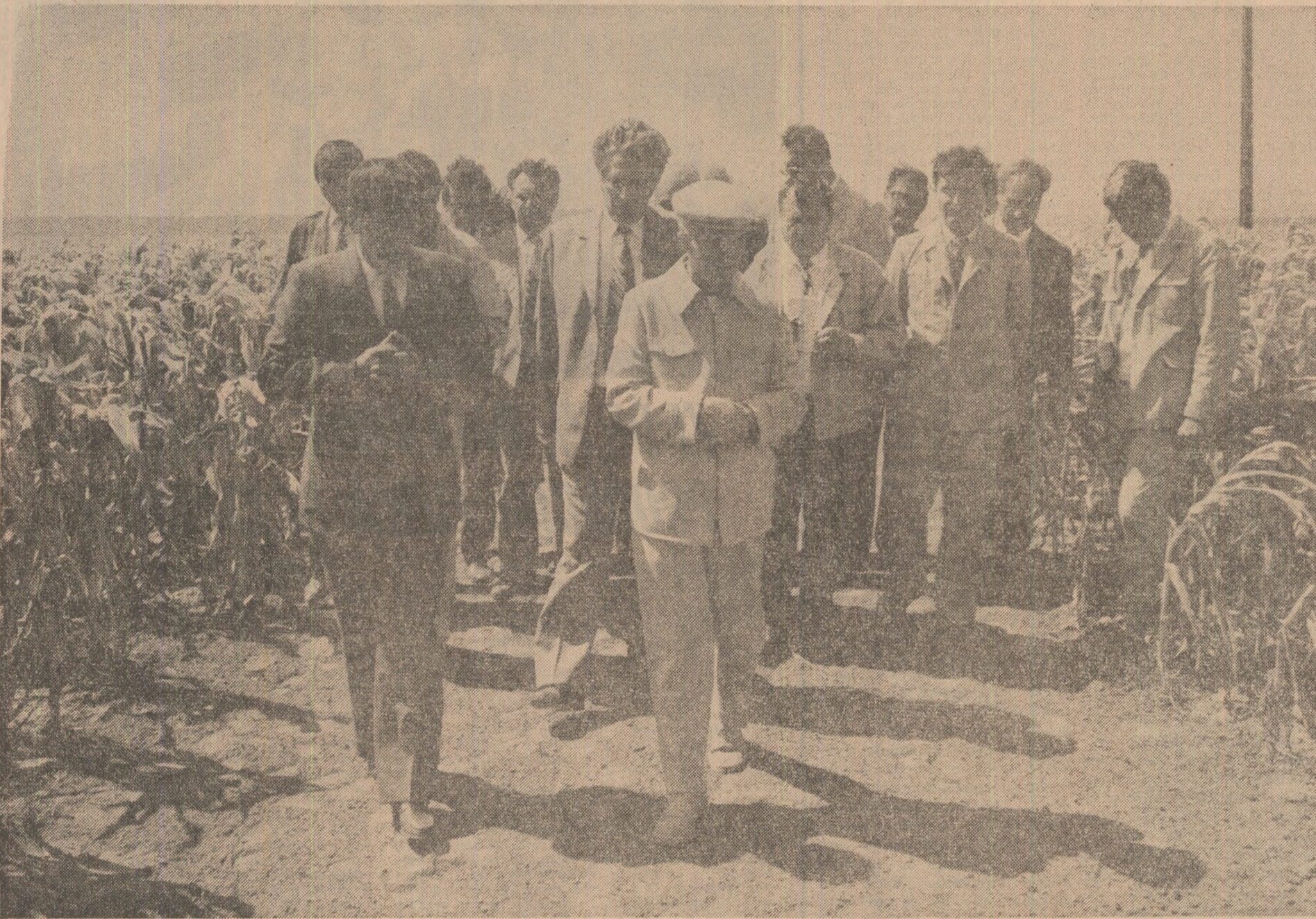
(Urmare din pag. 1)

Unor grafice, date privind repartizarea culturilor în unitățile agricole ale județului, precum și evaluarea recoltelor în acest an.