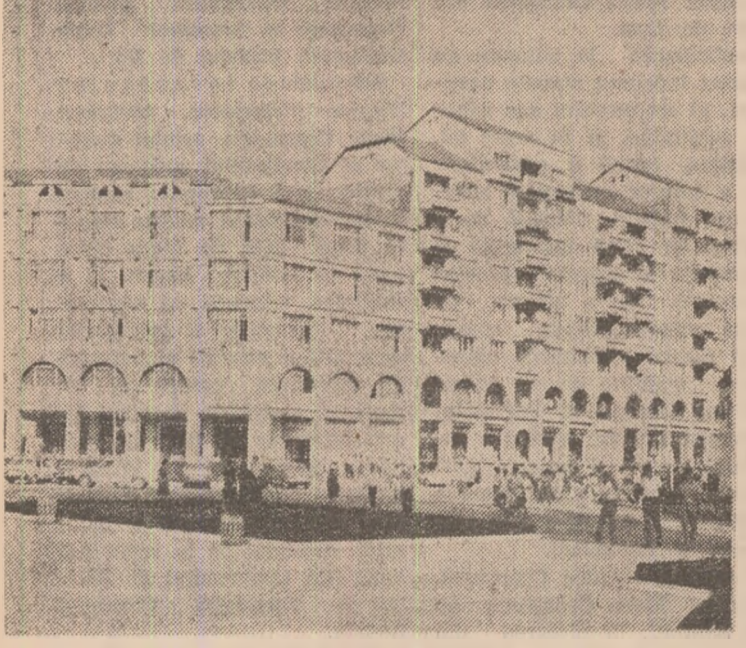
Imagine din Tiraoviste