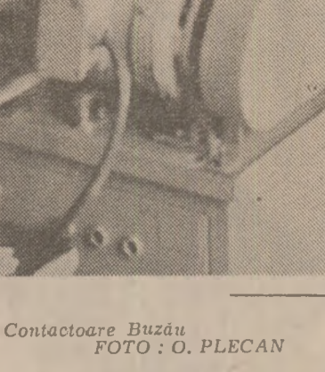
Întreprinderea de Contactoare Buzău