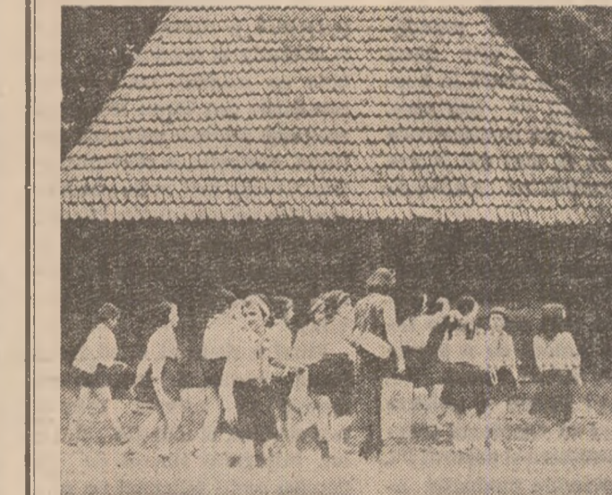
O primă lecție: lecția dragostei pentru străbuni