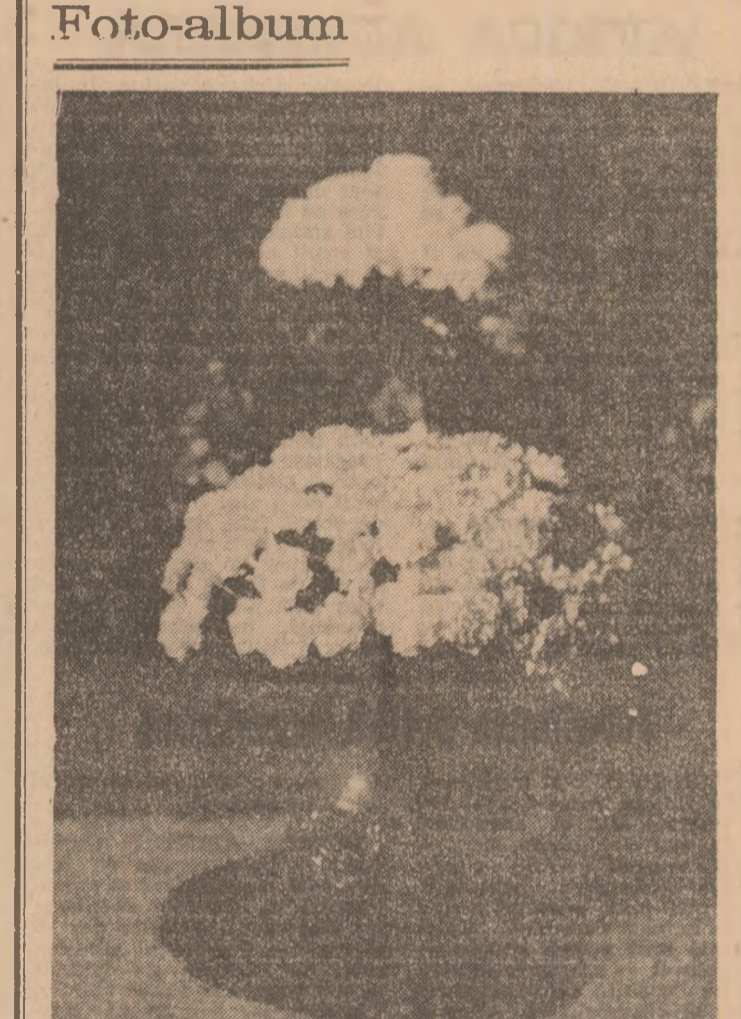
Flori de toamnă sunt cuvintele pe care le-am pășit scrise pe spațiile acestei fotografii primite la redacție și expediate de unul din corespondenții noștri...