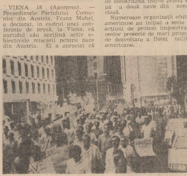
Aspect din timpul unei demonstrații a oamenilor muncii din orașul australian Brisbane împotriva creșterii șomajului

NAȚIUNILE UNITE 18 (Agerpres). — Secretarul general al O.N.U., Javier Perez de Cuellar, s-a pronunțat — la o întâlnire cu ziaristii, la New York — în favoarea intensificării eforturilor pe plan internațional pentru apărarea păcii. Carta Națiunilor Unite — a spus el — se bazează pe învătăminte celui de-al doilea război mondial, potrivit cărora „sunt necesare un sistem internațional de securitate colectivă și o acțiune colectivă pentru a se elimina pericolul războiului atomic”.