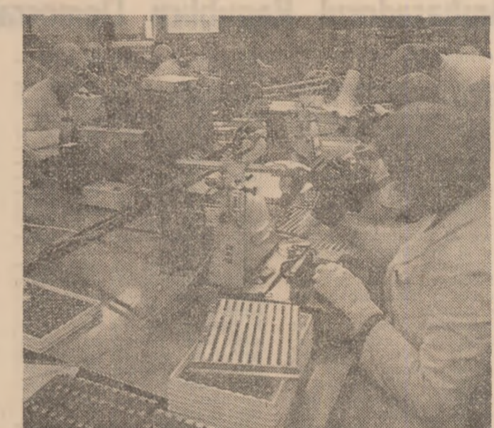
R.S.F. IUGOSLAVIA : Unul din laboratoarele de microelectronică ale întreprinderii „Iskra” din Slovenia

În U.R.S.S., deși cu o tradiție îndelungată, construcția de autovehicule înregistrează noi pași pe calea perfecționării și modernizării. Astfel, Uzinele de automobile de pe Volga, cunoscute prin producția autoturismelor „Lada”, deși realizează un autoturism la fiecare 20 de secunde, se află în plin proces de transformare și modificare ceea ce va permite ca, în următorii cinci ani, fără să facă apel la resurse suplimentare, să mărească și să diversifice considerabil producția.