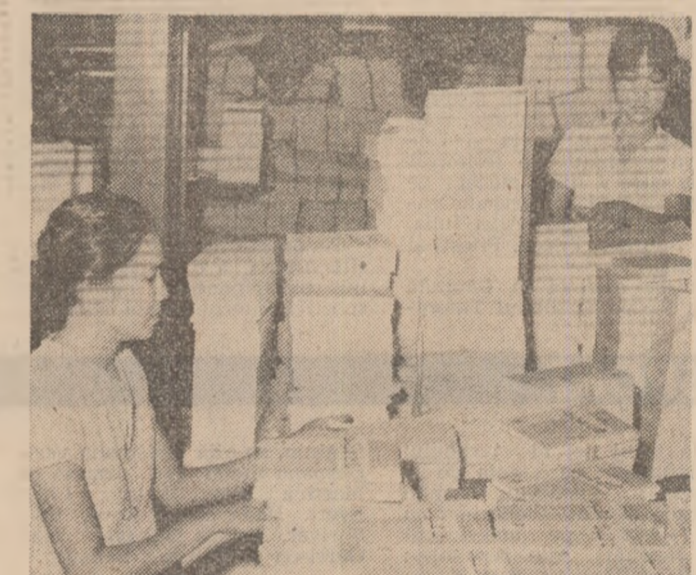
R.S. VIETNAM : Pentru noul an școlar, Tipografia Dien Hong a tipărit peste 30 noi manuale școlare în mai mult de un milion de exemplare

În această țară, agricultura constituie o sursă de înflorire din punct de vedere al producției și al nivelului de trai. În anul 1990, peste 400 de milioane de hectare de teren, pe care se află culturile agricole, de perfecționare a muncii în agricultură, au fost incluse în sistemele de irigații, ceea ce înseamnă o creștere de 10% a suprafeței irigate. În prezent, peste 44000 ha cu culturi agricole au fost irigate, lucru care face ca în prezent, în R.D. Germană, suprafața irigată să fie de 1,2 milioane hectare și să fie irigate.