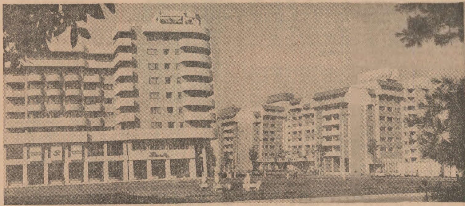
Imagine din municipiul Brăila