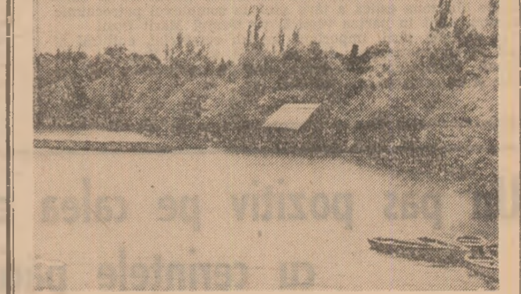
Toamna pe lacuri