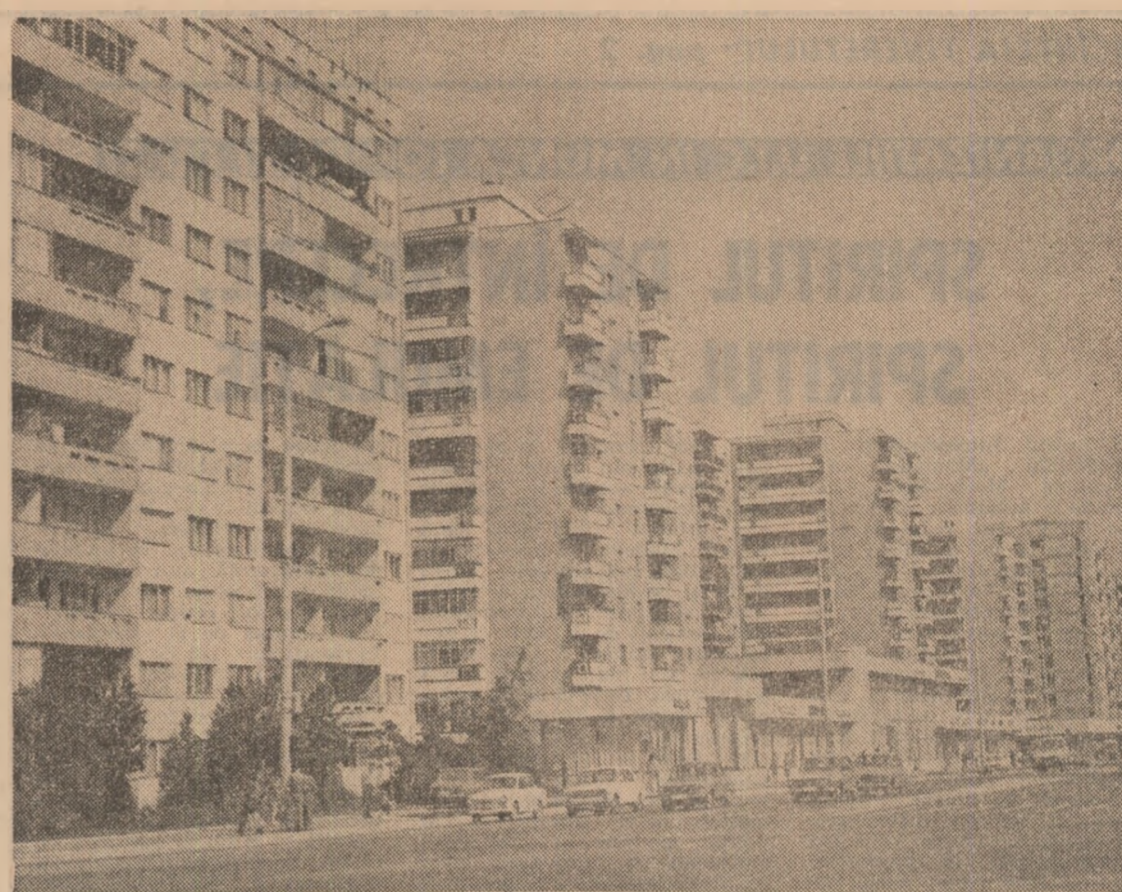
Imagine din Buzău