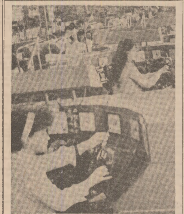
UN NOU OBIECTIV ENERGETIC PUS ÎN FUNCȚIUNE