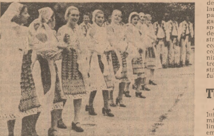
Perpetua tinerețe a portului popular