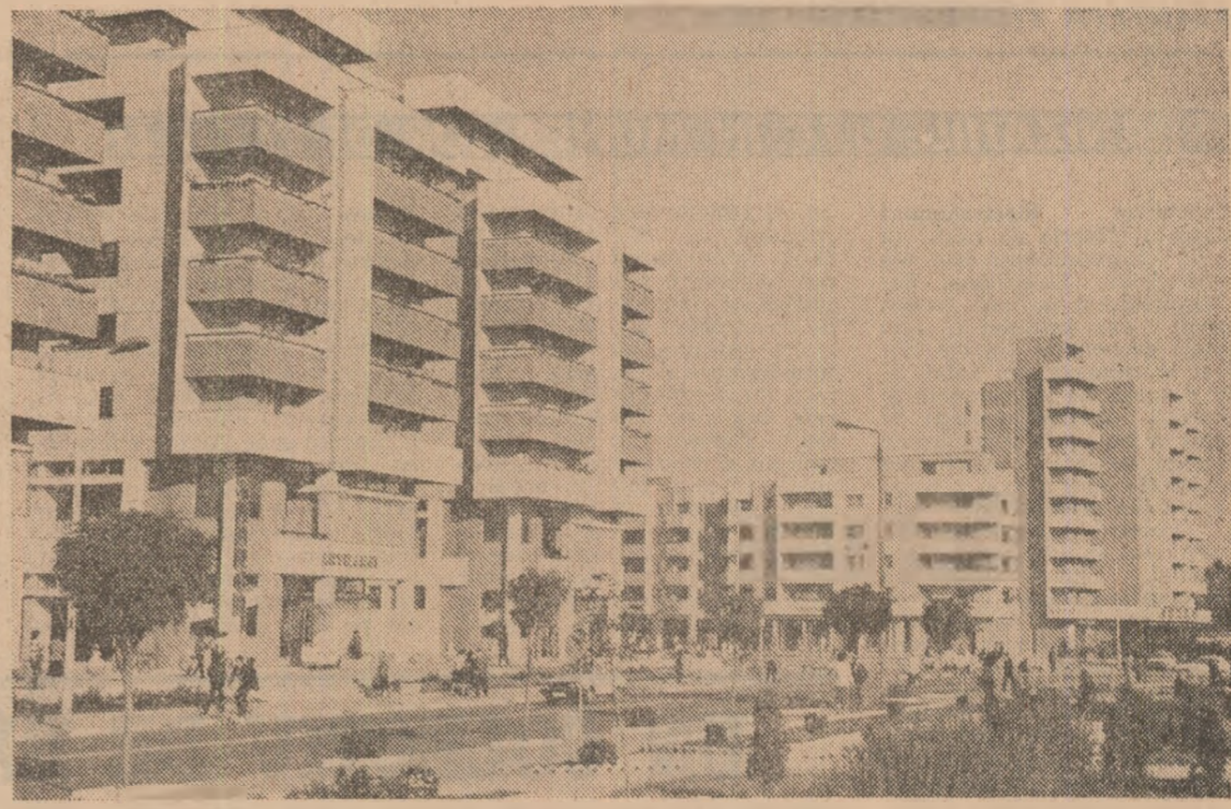
Roșiori de Vede

Or, cum în momentul de față ne lipsește conductorul din care se execută cordonul prizelor multiple, rotunde sau triple, nu putem livra nici interupătoarele, nici aplicele sau alte aparatele de joasă tensiune care fac obiectul contractelor noastre la export, desigur, cum spuneam, acestea sunt fabricate, costume populare; la „modă” acum e țesătura în patru ste, din bumbac alb, pe care se brodează flori și se prind ibrisine și mărgele, pe platca și pe manșetele cămășii, dar și pe cordonul și titul poalelor; abia le ții în mână de grele ce sint. Baticurile vechi, din cașmir curat, cu dungă discretă în jecătură și împănate cu flori de toate felurile, au ajuns la marea pref. Mășez pe lavița de lemn întrebând pentru cine sint atâtea costume atât de bogat lucrate în casa care pare un adevărat muzeu popular. De la cele două fete ale mele, am trei nepoți și o nepoată de 14 ani; pentru ea sint toate hainele astea, așa e obiceiul la noi, fetele trebuie odite, le faci și zestre din vreme-