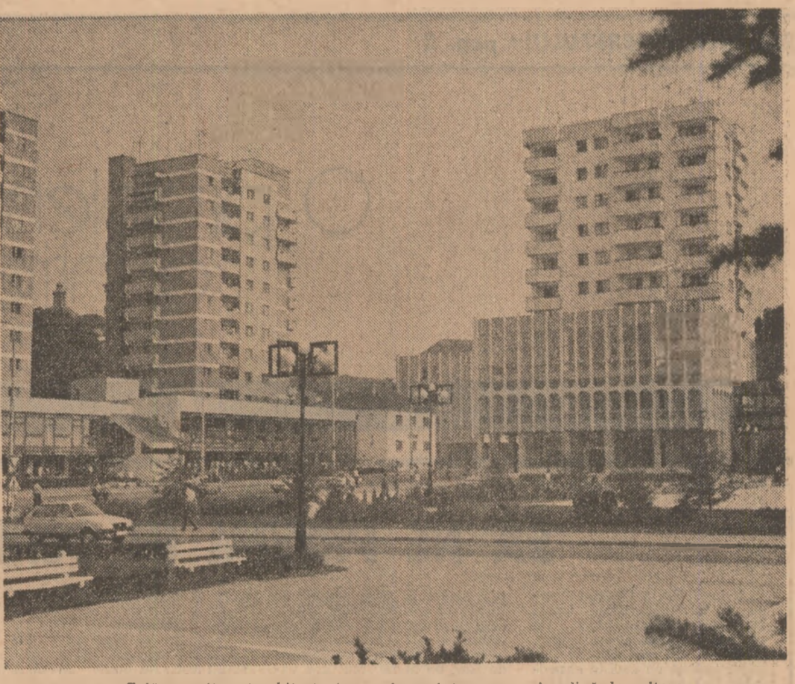
Zalău — ritmuri arhitectonice moderne într-un oraș în plină dezvoltare

C. MAXIMILIAN (Continuare în pag. a V-a)