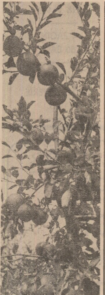
Rod de toamnă bogată