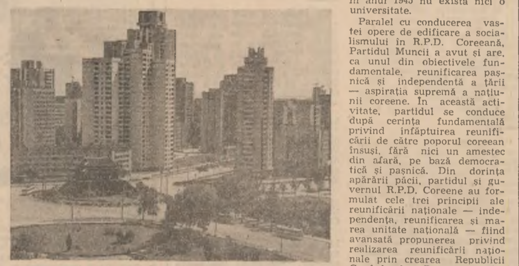
În eforturile vizând înlăturarea celor zece obiective prioritare ale economiei, prevenirea de cel de-al treilea plan septenal 1987-1993...

Domeniile în care tineretul Republicii Populare Democratice Coreene își afirmă astăzi capacitatea sa creatoare, eșantion și dăruirea, vocația constructivă pasnică sunt numeroase, rezultatele implicării sale responsabil fiind prezente pe întregul teritoriu al țării.