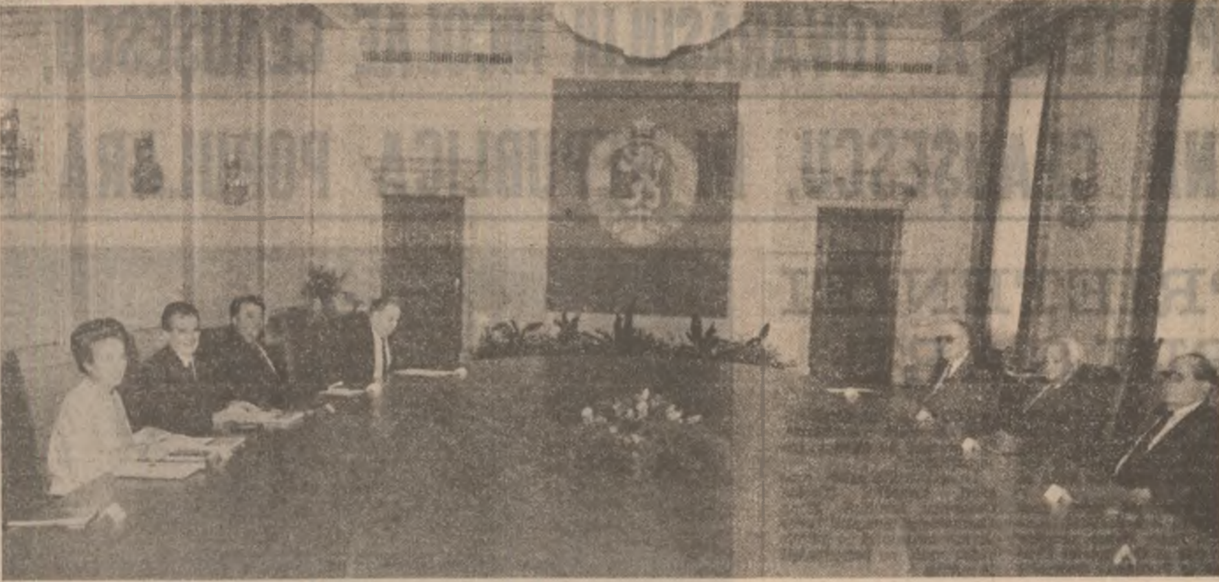
socialismului, înțelegierii și cooperării internaționale. Tovarășii Nicolae Ceaușescu și tovarășul Todor Jivkov au

În cadrul ultimei runde de convorbiri, tovarășii Nicolae Ceaușescu și Todor Jivkov și-au exprimat satisfacția față de rezultatele vizitei, ale dialogului purtat, în aceste zile, apreciind că transparența în viața a hotărârilor stabilite va contribui la dezvoltarea în continuare a relațiilor de prietenie și colaborare româno-bulgare pe plan politic, economic, tehnico-stiințific, cultural și în alte domenii de activitate, în interesul ambelor țări și, în special, al progresului și prosperității lor, al cauzelor generale a