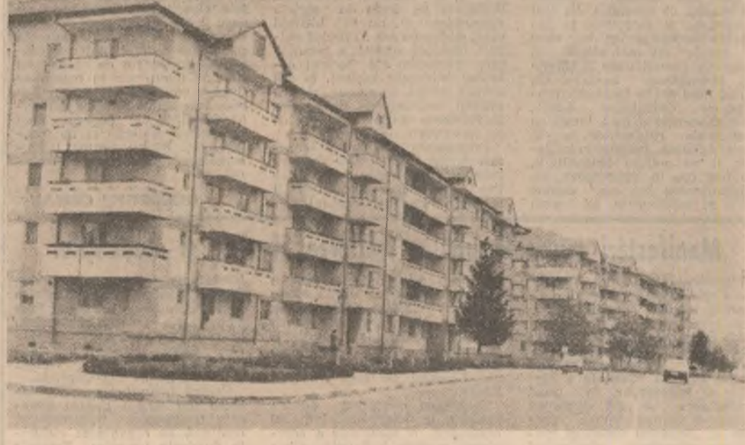
Orașul Urziceni — județul Ialomița