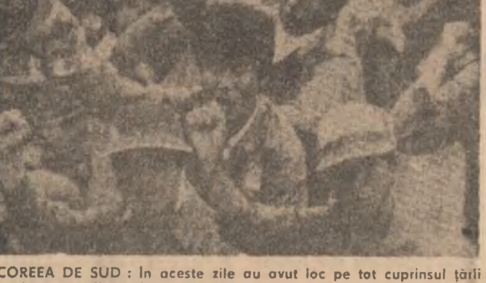
COREEA DE SUD: În aceste zile au avut loc pe tot cuprinsul țării demonstrații ale tinerilor în favoarea unor reforme democratice