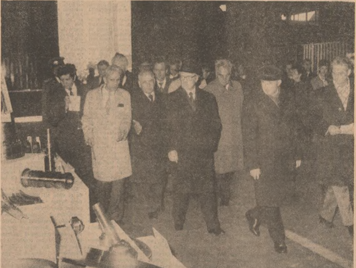
Tovarășii Nicolae Ceaușescu, secretar general al Partidului Comunist Român, președintele Republicii Socialiste România, și tovarășul Erich Honecker, secretar general al Comitetului Central al Partidului Socialist Unit din Germania, președintele