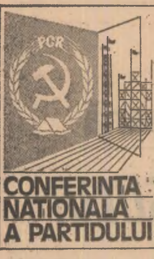
CONFERINȚA NAȚIONALĂ A PARTIDULUI