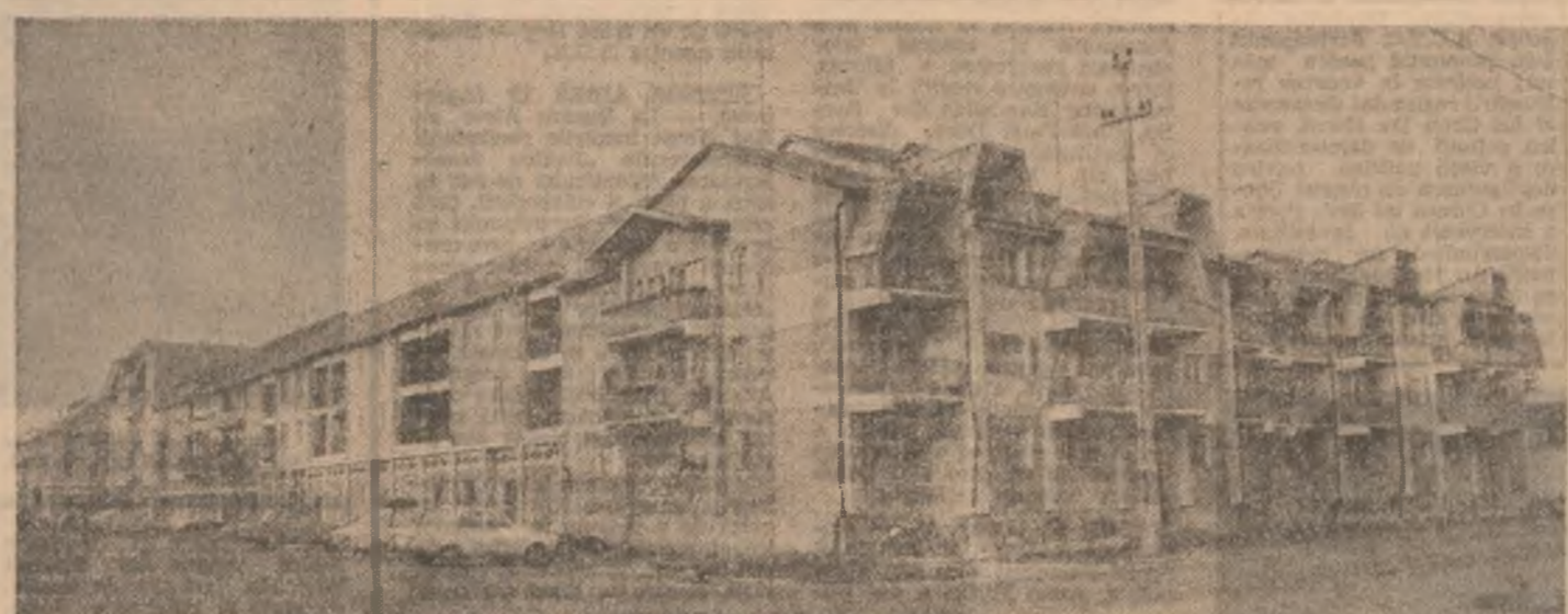
O imagine a noii urbanistici din Nădlac, județul Arad.